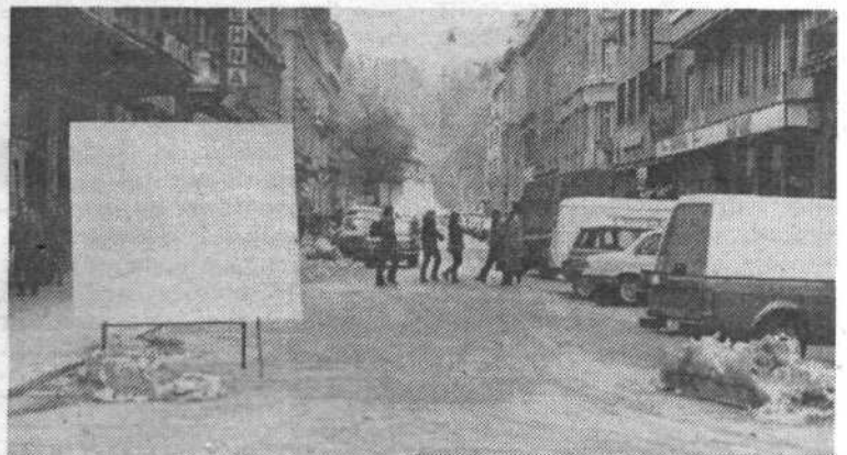
ZIMSKA SLUŽBA IN NJEN SPOPAD S SNEGOM