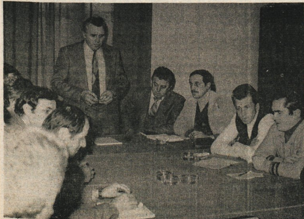
Pogovor o delegatskem sistemu v krajevni skupnosti Komenda