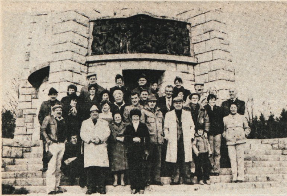
Skupina kamniških planincev na obisku v Ložu in na Travnici gori.