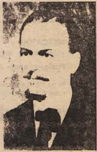
Josip Jurčič, slovenski pisatelj (original podobe hrani študijska knjižnica v Mariboru)

Letos smo v Jurčičevem jubilejnem letu: ta naš plodoviti dolenski pripovednik se je rodil pred 125 leti, 4. marca 1844 na Muljavi pri Stični. Pisati je začel že kot dijak. Ko je bil sedmošolec v Ljubljani, je napisal romantično ljudsko povest o slovenskem janičarju Juriju Kozjaku. Za povest je dobil od Mohorjeve družbe, ki je tedaj razpisala nekaj nagrad za domače povesti, prvo nagrado — 100 goldinarjev. Njegov spis je odbor Mohorjeve družbe ocenil kot najboljšo predloženo povest, drugo nagrado pa je takrat podelil pisatelju Franu Erjavcu za »Hudo brezno ali Gozdarjev rejenc«.