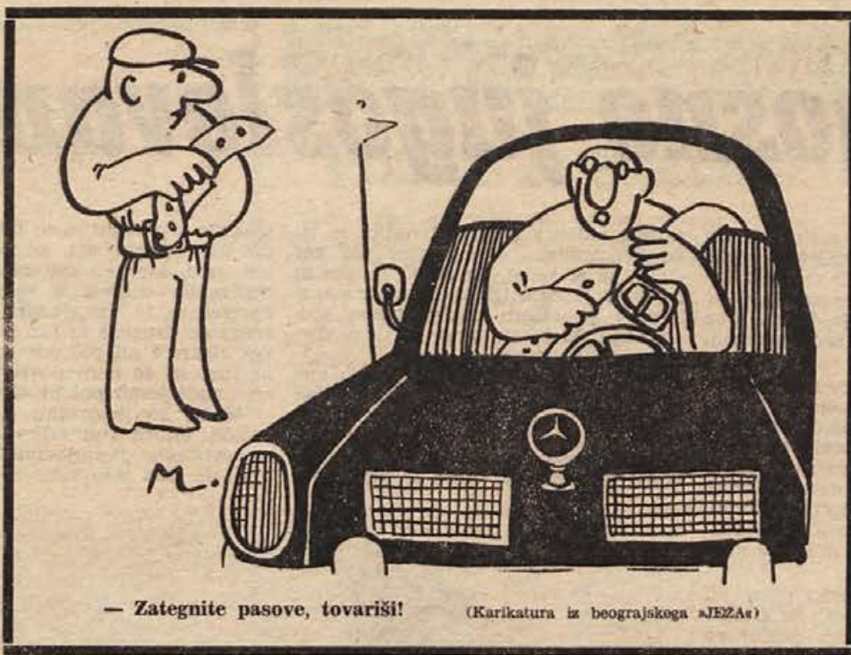
— Zategnite pasove, tovariši!

Na tiskovni konferenci so povedali, da se je podjetje Glanzstoff AG pred kratkim združilo z nizozemsko firmo AKU in tako postalo eno največjih tovrstnih podjetij na svetu. Danes ima grupa AKU največje izbirno kemičnih vlaken, v proizvodnji sintetičnih vlaken kot so perlon, nylon, diolen, terlenka in enkalon pa ima grupa AKU drugo mesto na svetu. Naša podjetja si od sodelovanja v okviru Diolen kluba obetajo nadaljnje ugodne možnosti.