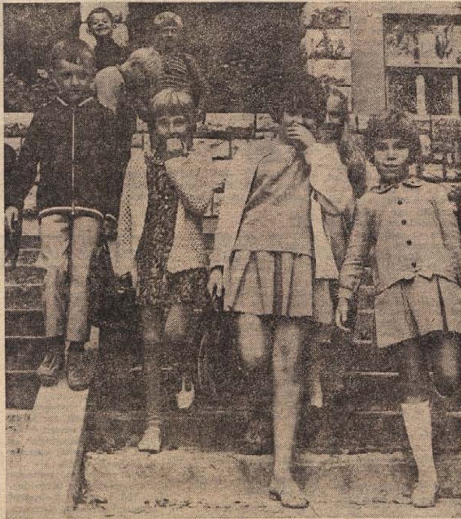
Danes mladost ni tako brezskrbna, kot si včasih mislimo. Šolarke iz Črnomlja gredo sicer veselo od pouka, aktivke pa imajo težke, da jih komaj nosijo. V mestih so starši v službi, otroci so marsikje brez pravega varstva, na deželi pa morajo šolarji še krepko delati po njivah.

Strokovnjaki cenijo, da so belokranjska jabolka, ki ne gredo v denar in bodo propadla, vredna najmanj 30 milijonov starih din. Jabolka so bogato obrodila, ker pa so slabše kvalitete, so primerna samo za industrijsko predelavo. Tovarne jabolk ne morejo porabiti v tako velikih količinah in kmetje imajo že polne sode jabolčnika. Veliko sadja leži kar po tleh. Jabolka grize živina, zato se večkrat zgodi nesreča, ker se živali davijo. Na marsikateri domačiji so že sklenili odvisna jabolka zvoziti na polje, kjer jih bodo pustili zgniti.