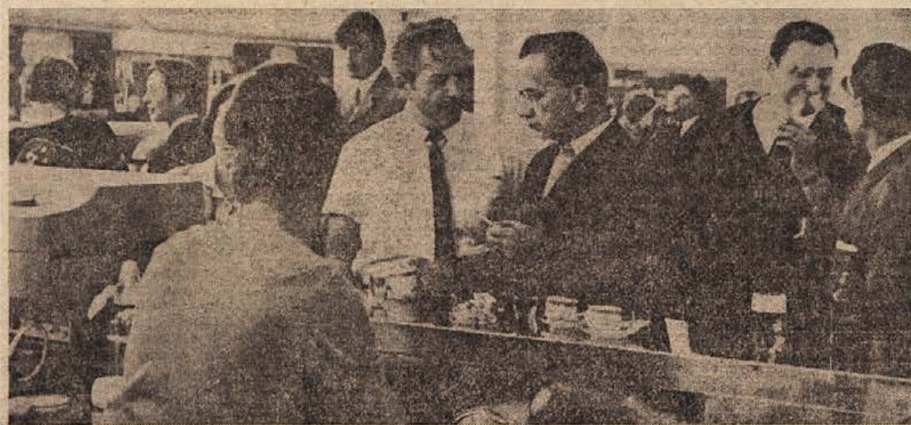
V nedeljo, 21. septembra zjutraj, je novomeški hotel METROPOL v podaljškju svoje kavarne pri avtobusni postaji odprl novo ekspresno restavracijo. V lokalu, ki je eden najsodobnejših na Dolenjskem, se je že navsezgodaj zbrala množica poskuševalcev pijač in jedoč, večja gneča pa je bila v prvih urah predvsem pri šanku, kjer so lahko obiskovalci zastoj pili ekspresno kavo

V nedeljo dopoldne, 28. septembra, bo Kmetijska zadruga Trebnje v sodelovanju s Kmetijskim zavodom Ljubljana priredila razstavo živine in kmetijskih pridelkov na Veseli gori pri Sentrupertu. Najboljši rejci bodo dobili za svojo živino denarne nagrade. Turistično društvo Sentrupert bo popoldne priredilo veselico ob otvoritvi vodovoda.