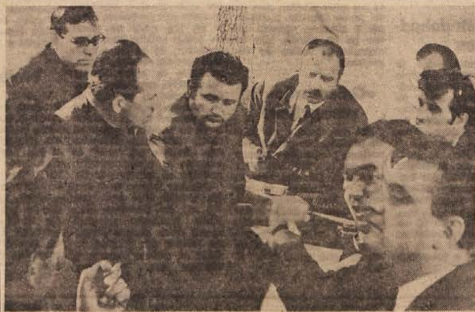
Komisija za licenciranje proge je v četrtek zasedala pri Badovincu.