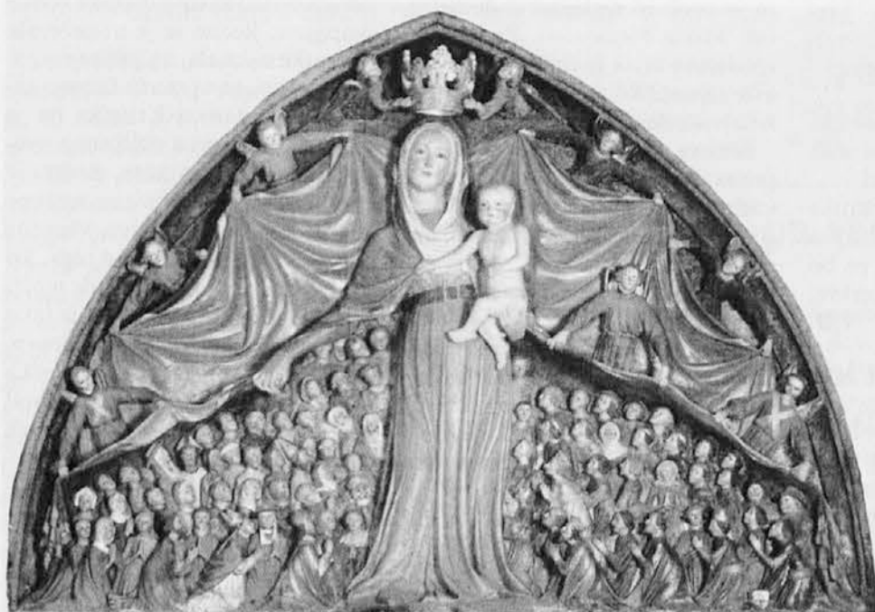
Milostna podoba Matere božje na Ptujski gori

Da je Marija popolnoma pri Bogu, je potemtakem predvsem bivanjska razsežnost in ne neka miselna podoba ali tvorba. Ravno zato je vsakomur na svoj način pri roki in na voljo, da mu v osebnem (bolj kot osebno) jedru sporoči nekaj bivanjsko lepega, dobrega in resničnega.