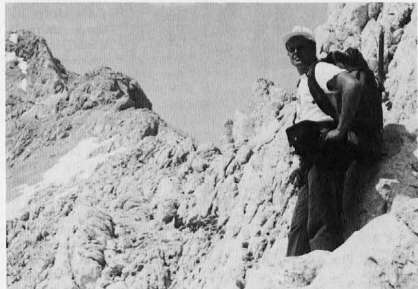
Tudi previdnost naj bo zvesta sopotnica ljubiteljev gorã v teh poletnih dneh.