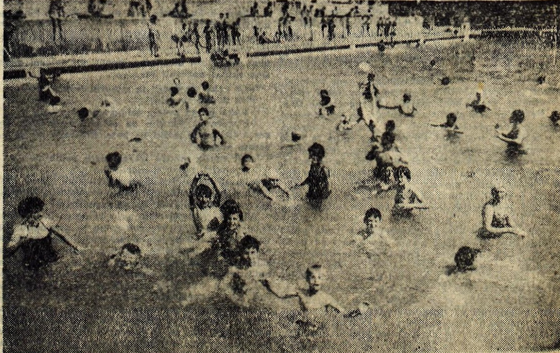
Yzoci umevi vanju v kopaljšča...

ODGOVOR: Zakon o stanovanjskih razmerjih točno določa razloge zaradi katerih vam lastnik družinske stanovanjske hiše lahko odpove stanovanjsko pogodbo. Ker v vašem primeru ni podan noben od z zakonom naštetih razlogov, vas lastnik stanovanjske hiše ne more postaviti na cesto. Tudi če bi obstajal kakšen bistven razlog, ki ga zakon določa, vam lastnik stanovanjske hiše mora preskrbeti najpotrebnejše prostore za stanovanje. Stanovanjska pogodba se lahko odpove nosilcu stanovanjske pravice samo s tožbo, ki se vloži pri okrajnem sodišču.