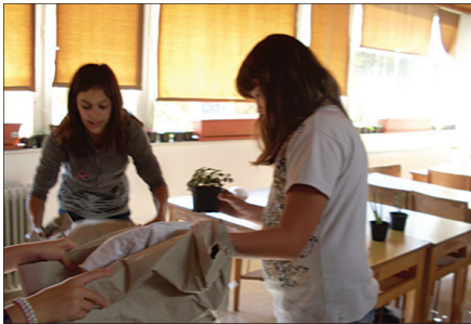
Treba je tudi pospraviti.