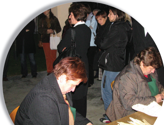
Demonstracijska delavnica pletarstva iz ličja v Mali Polani