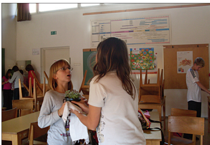
»Pusti! Ta krpa je moja!«