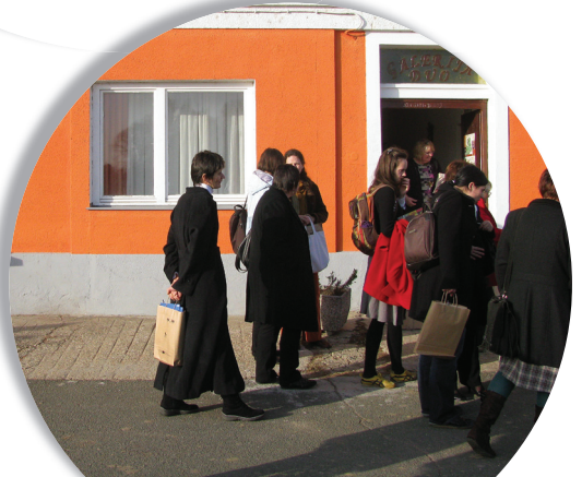
Ogled Centra DUO v Verzeju