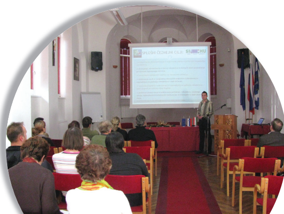
Info-motivacijska delavnica za rokodelce v organizaciji Centra DUO

Osnovno izhodišče konference je bilo, da sta celostni razvoj in strokovna nadgradnja rokodelskih poklicev pomemben vidik trajnostnega ohranjanja in revitalizacije dediščine v vseh njenih pojavnih oblikah. Na konferenci smo, skupaj s priznanim strokovnjaki, poskušali odgovoriti na vprašanja o priložnostih in ovirah formalnega in neformalnega izobraževanja za rokodelske poklice, o usposabljanju rokodelcev v podjetniških, marketinških in konservatorskih veščinah ter o spodbudah programov EU za ohranjanje in razvoj rokodelske dediščine na podeželju. Dogodka se je udeležilo več kot 70 slovenskih in madžarskih predstavnikov stroke, izobraževalnih in kulturnih institucij, podjetnikov, rokodelcev in turističnih delavcev.