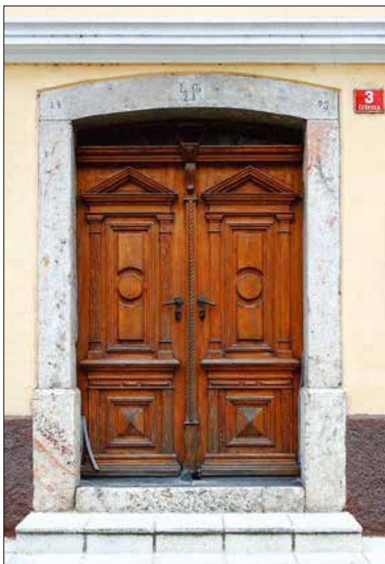
Vhodna vrata z letnico 1893.