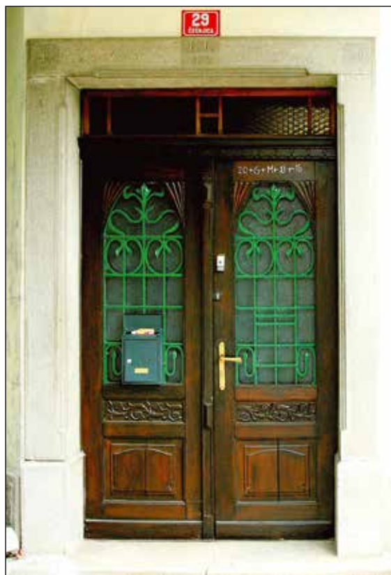
Vhodna vrata z letnico 1929.