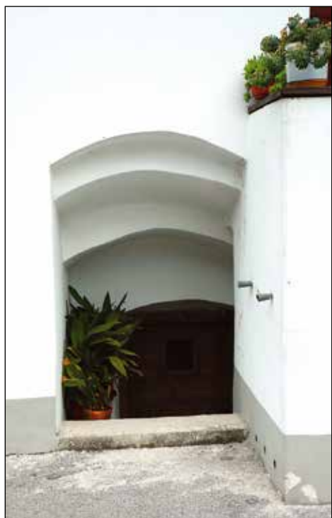
Obokano stopnišče v klet hiše.