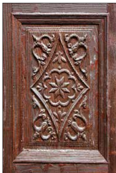
Detajl lesoreza vhodnih vrat.