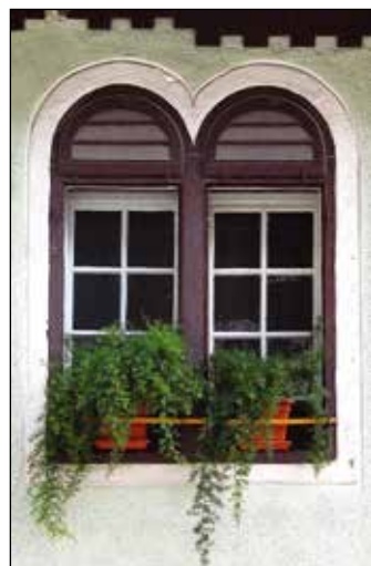
Detajl okna nad vhodom.