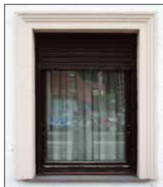
Okno s štukaturo.