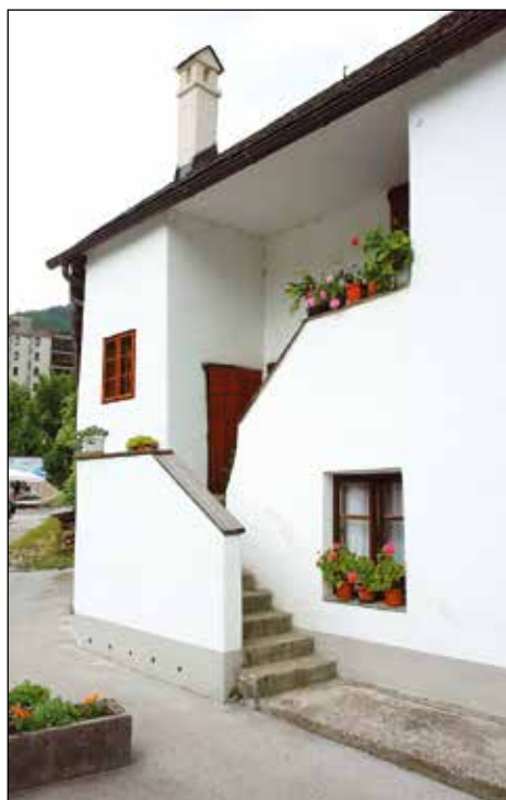
Stopnišče v nadstropje na vhodnem delu hiše.