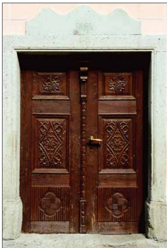
Vhodna vrata z letnico 1864.