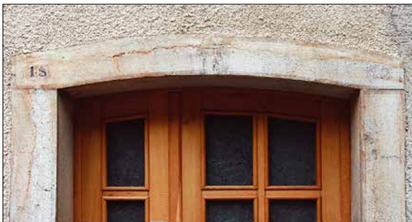
Detajl vhodnih vrat z letnico 1890.