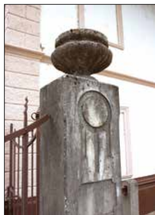
Betonski steber železne ograje ob hiši.