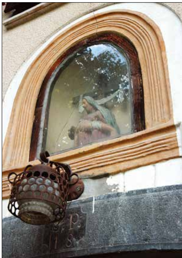
Zastekljeno znamenje nad vhodom.