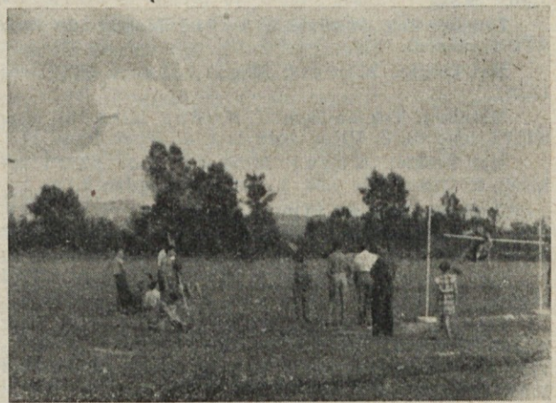
Prizor s tekmovanja skok v višino — mladinci