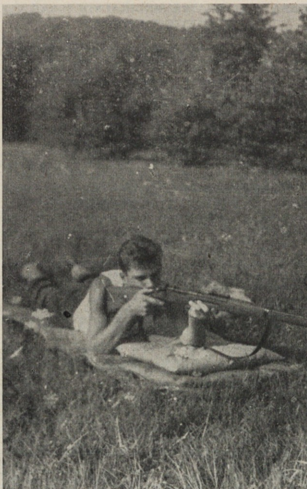
Sarec strelja z vojaško puško na 100 m