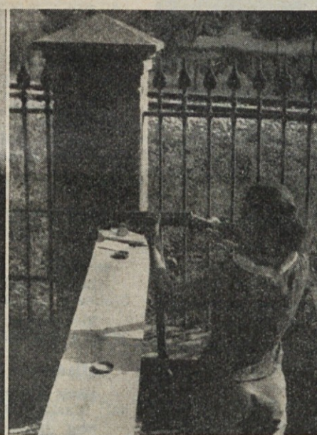
Kavčičeva tekmuje v streljanju