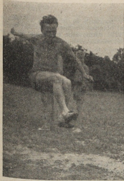
Ukmar — daljina