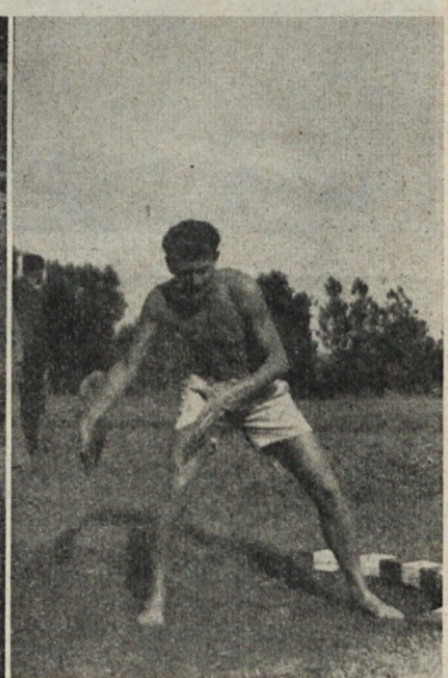
Narobe — disk