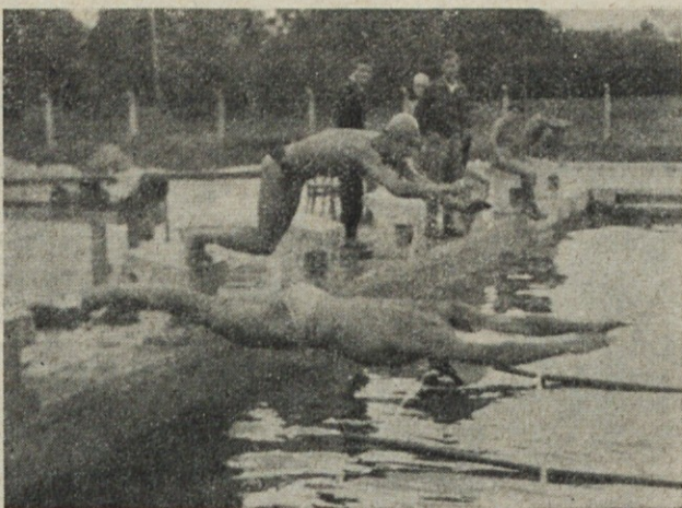
Start za plavanje 50 m — prosto v Domžalah

Tekmovanje je potekalo brez nezgod v fair obliki, za kar so poleg določenih sodnikov poskrbeli tudi tekmovalci sami.