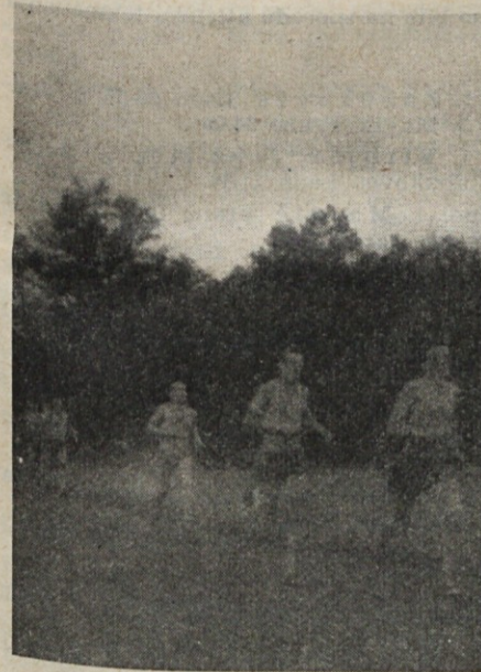
Med tekom na 800 m