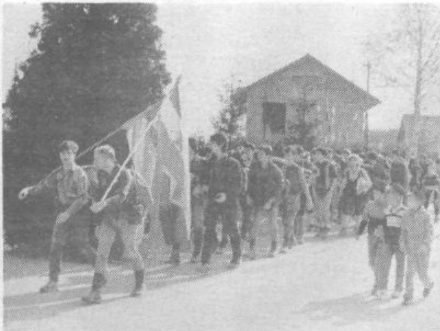
... Pohodniki MPE Ljubo Šercer so z Brezovice krenili na večdnevni pohod Po poteh borb in zmag.