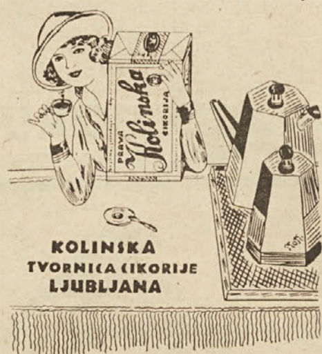
KOLINSKA TVORNICA CIKORIJE LJUBLJANA