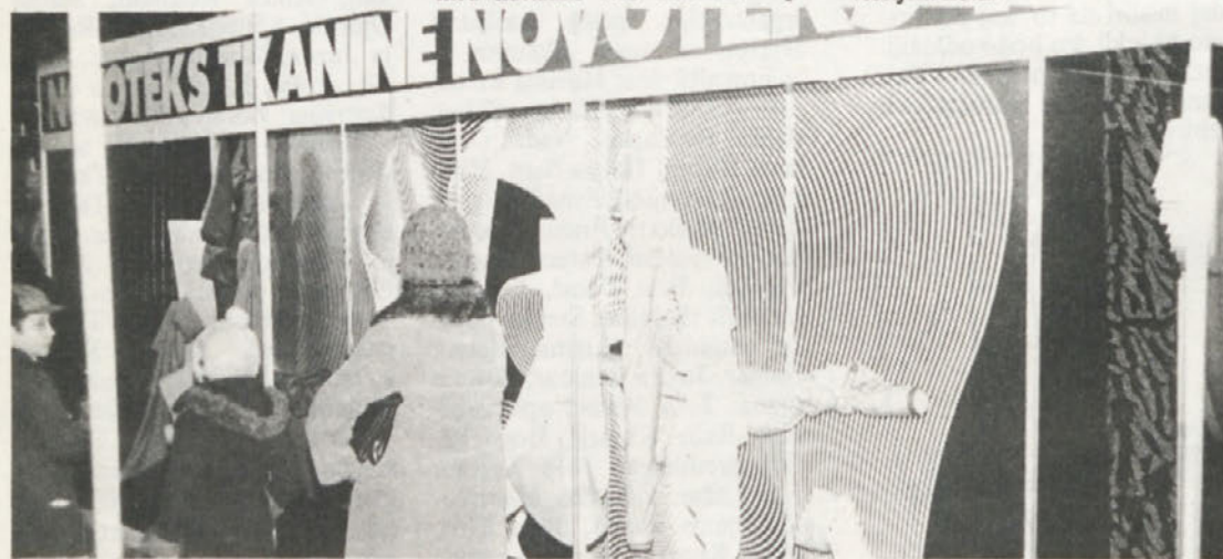
Naš razstavni prostor na „Sejmu mode“ si je ogledalo veliko število obiskovalcev