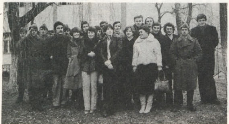
Z vsakoletnega obiska naših mladincev v kasarni „Milana Majcna“