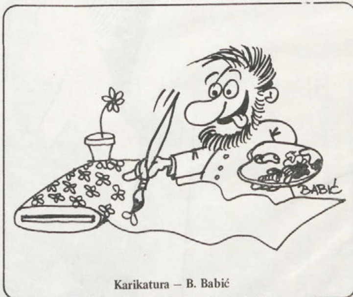
Karikatura – B. Babić

5. In ne nazadnje se moramo vsi zaposleni v Novoteksu zavedati, da sanacija naše delovne organizacije še traja in da lahko prav vsi pripomoremo, da bo uspešnejša.