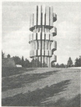
Veličasten spomenik na Kozari