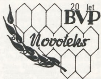
Osnetek značke ob jubileju BVP