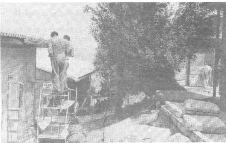
Delavca, ki sta nameščala nove žobove, sta se znašla – postelja na posteljo je lestev. Tovarišice iz vseh letošnjih izmen v Pacugu so prijelo v roke iztepeče in očistile jogi vzmetnice.