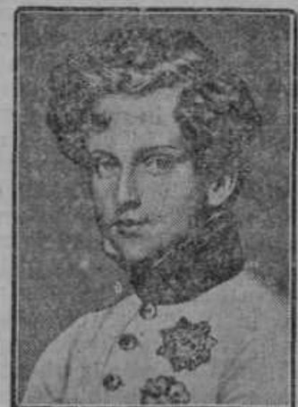
Pred 100 leti — dne 22. julija 1832 — je umrl edini Napoleonov sin, Napoleon Franc Jožef Karl, kralj rimski, na dvoru svojega starega očeta v Schönbrunnu na Dunaju.