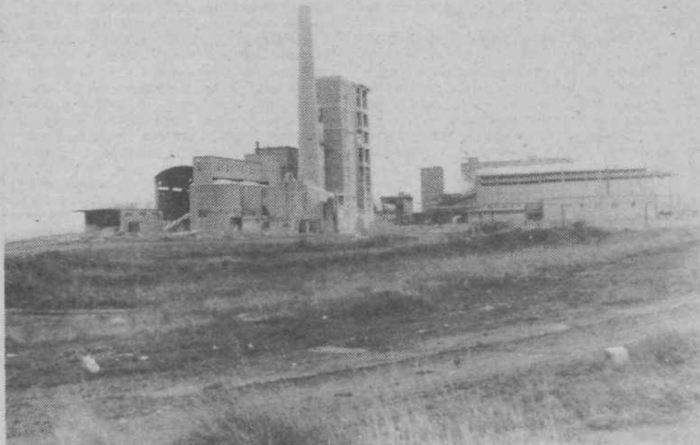
V Umagu naredijo na leto 210.000 ton cementa in klinkerja.