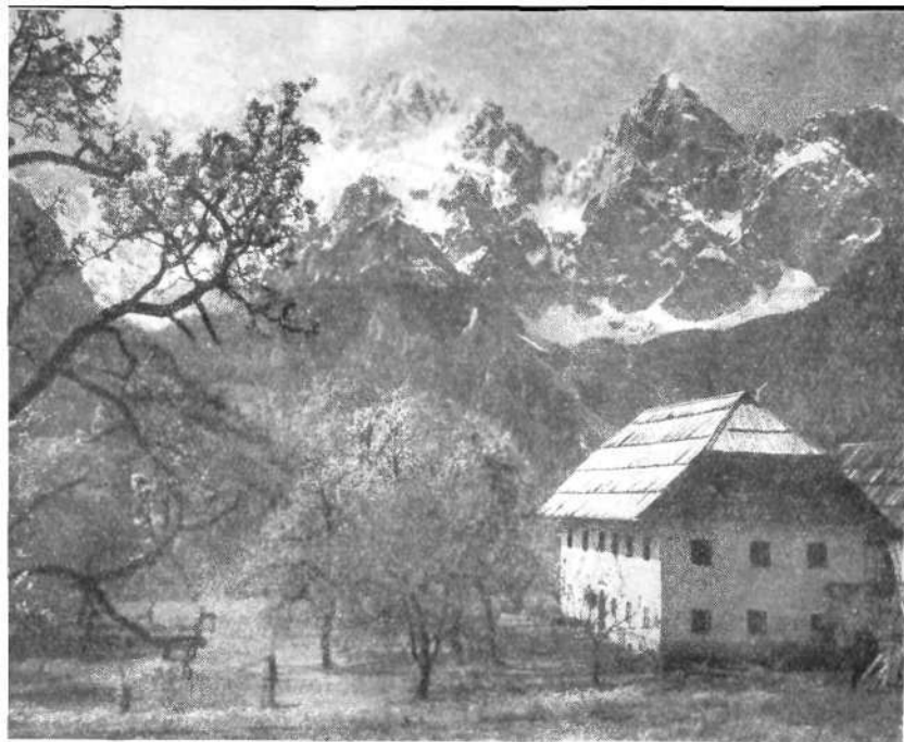
POMLAD V MÄRTULJKU