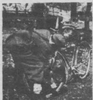
Partizanski kurir-kolesar