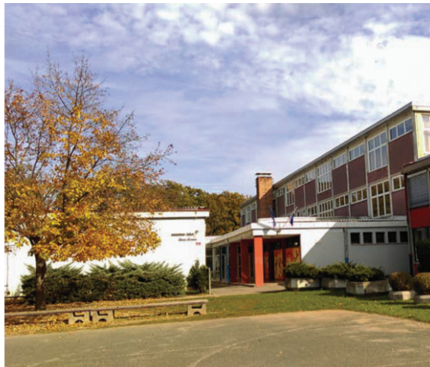
Osnovna šola Slave Klavore Maribor

Omenjene trditve (zaščitene s »svobodo govora«) se nenehno ponavljajo in naj bi upravičevale mnogostranske praktične ukrepe za moralno in materialno »prenavljanje« slovenske družbe po njeni »osvoboditvi« izpod »komunizma«. Zagovornikom prave »demokracije« predstavljajo veliko oviro za popolno »prenovo« tudi različni spominski dogodki v zvezi z NOB, ki da »delijo ljudi« in preprečujejo, da bi dosegli »konsenz« o obsodbi »totalitarizmov«. Po pričanju teh »drugače mislečih« spadajo med ovire tudi imena šol, kolikor še niso (bila) »osvojenjena« zveze s partizanskim bojem ali (prosto po Himmlerju) »komunističnih« oznak. Da bi lažje dojel pomembnost te ovire, je pojasnje-