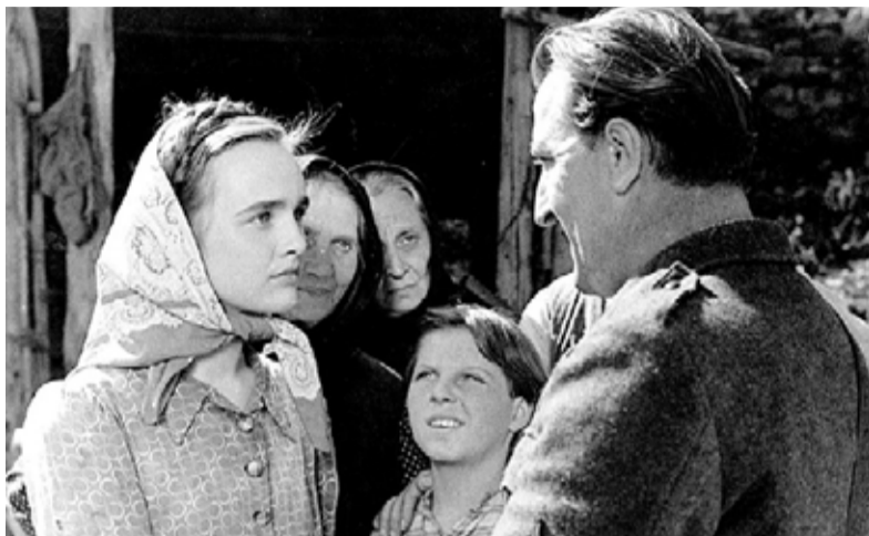
Prizor iz filma Na svoji zemlji.

V celotnem opusu Franceta Štiglica (1919-1993), ki obsega skoraj 40 let, sta jasni ideja o snovi, ki jo av-