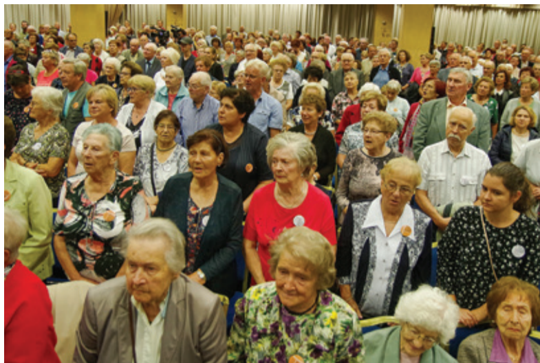
Osnovna šola Milojke Štrukelj Nova Gorica