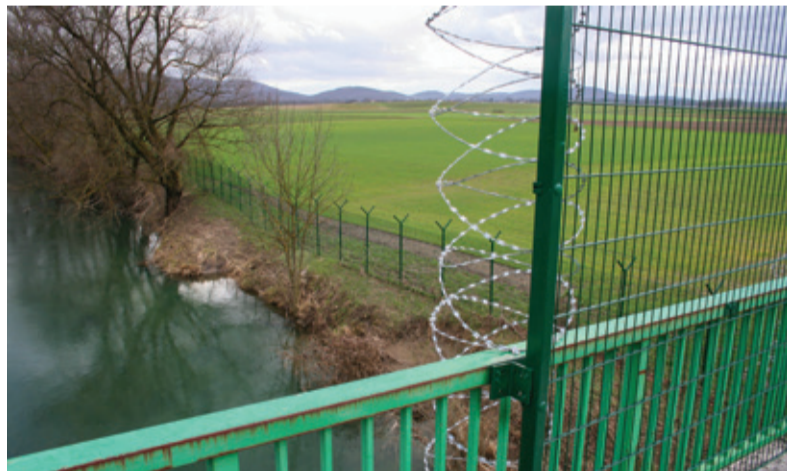
Pogled na letališče Krasinec danes: meja in rezilna žica

26. marca 1945 je zgodaj zjutraj sovražno letalo odvrlo bombe, ki na srečo niso zadele letališča. Podobno je bilo dva dni pozneje, is-