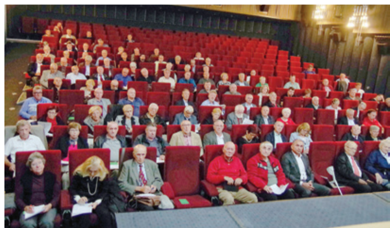
Udeleženci volilne seje Glavnega odbora ZB