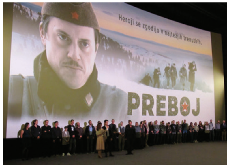
Predpremiere v Koloseju v Ljubljani in predstavitev filmske ekipe

Tako se je zbrala in angažirala generacija po vojni rojenih, rekel bi, da so to vnuki naše generacije, ter uradno začrtala in izpeljala kadrovsko-organizacijske, operativne, finančne in druge zadeve okrog filma pod pokroviteljstvom Zveze združenj borcev Slovenije z