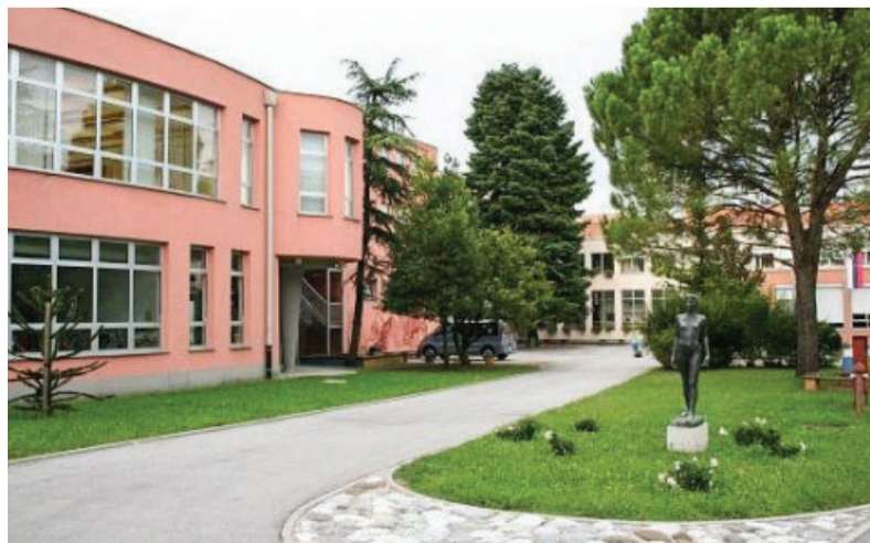
Osnovna šola Milojke Štrukelj Nova Gorica

Za pregled sedanjih imen vseh šol na seznamu iz leta 2009, ki do tedaj niso presekale vsem vidnih znakov duhovnih vezi z NOB, bi bil potreben daljši čas; bi pa bilo to pregledovanje vsekakor potrebno glede na neprekinjenost teženj po čiščenju in v nekaterih primerih učinkovitih posegov (saj naj bi po A. Bergerju bilo letos še 66 takšnih šol). V sedanjem trenutku sem morala omejiti zanimanje na vprašanje, ali so deset let pozneje (2019) »ideo-