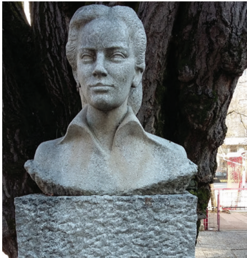
Osnovna šola Majde Vrhovnik Ljubljana

Morda se bo komu zdelo ukvarjanje z imeni šol preveč drobnjakarsko in nepotrebno. Prepričana sem o nasprotnem, kajti izobraževanje ne poteka kjer koli, temveč v zgradbah, katerih oznake kažejo na vrsto in stopnjo dejavnosti in lahko že tudi v imenu na zasidranost v določenem sistemu vrednot. Besedičenje o nevtralnno šoli je samo slabo zakrita tančica za vsestransko prežetost izobraževanja z (družbeno veljavni) vrednotami, v primeru slovenske prenovne s težnjami po spoštovanju univerzalnih »civilizacijskih vrednot« po meri protikomunizma. Odstranjevanje »komunističnih« sledi iz imen šol ima globlji pomen in nikakor ni niti naključno niti zanemarljivo. Gre pravzaprav za sistematično krčenje opornih virov za oblikovanje občutka pripadnosti izobraževalni ustanovi, ki bi vključeval ponos na odpor, na NOB in tudi na dosežke v zgodnjem socialističnem redu. Ponujena »drugačnost« vrednotne usmeritve (»Bog, narod, domovina«) pri vzgajanju sedanjih mladih ljudi, kot se kaže, nedvomno ni v prvi vrsti usmerjena v ohranjanje »aktivnega slovenstva«. V daljšem časovnem obdobju pa lahko pripomore k oblikovanju poslušnih robotov, kar končno ustreza nosilec neoliberalnega modela kapitalističnega gospodarstva s fašističnimi oziroma fašistoidnimi spremljevalci vred.