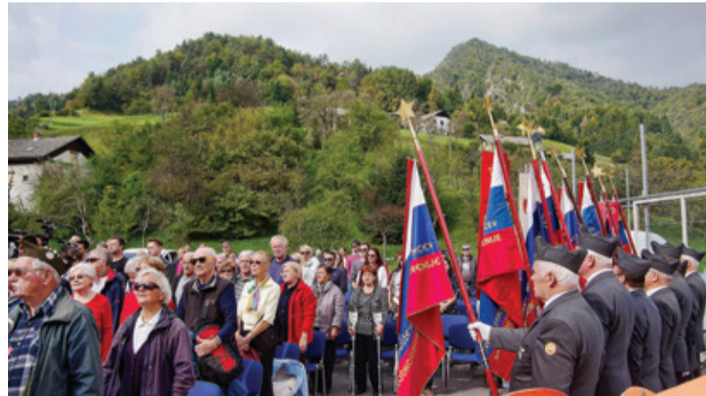
Prireditve je bila dobro obiskana.

Prav tako pa je tudi shod hvaležnega spoštovanja do naših junških prednikov v NOB, vseh njihovih žrtev in njihovega dela. Bili so enako izjemna generacija, kot je bil Prešeren izjemen pesnik in mislec. Govornik je sklenil: »Naj spomin nanje živi, dokler slovenski rod živi na zemlji tod, kot poje pesem!«