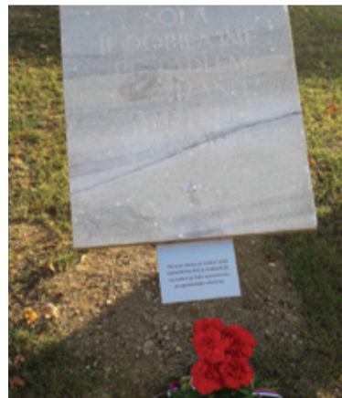
Spominska plošča ob domu krajanov.