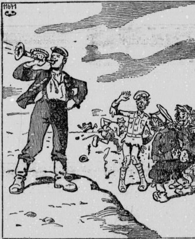
Preplašeni sporazumovci: »O jej, o jej! Viš ga, že zopet trobi in kliče nove čete. Pa so pravili, da so naši sovražniki že omagali.«

Moj podzemeljski dom se nahaja prav tik vasi. Prva hiša je samo deset