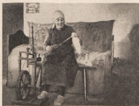
Putnarjeva mama iz Bilčovsa na preji.

V jezeru je utonila. — Dne 28. p. m. se je kopala v jezeru pri Sekiri mlada letoviščarka iz Štajerske. Plavala je globlje v vodo, nenadno jo najbrže prime srčni krč, moči ji odpovedo in izgine v globini. Valovi so reševanje ovrhali. Truplo so našli dan navrh.