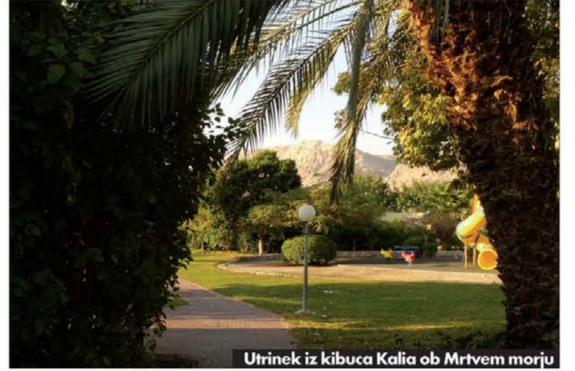
Utrinek iz kibuca Kalija ob Mrtvem morju