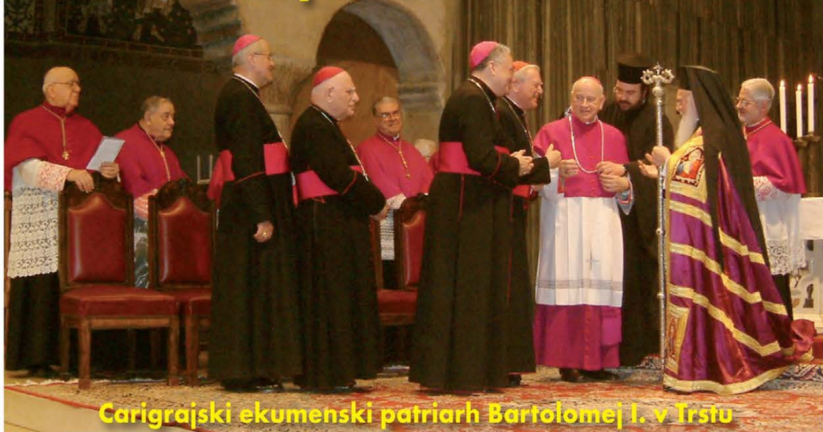
Carigrajski ekumenski patriarh Bartolomej I. v Trstu