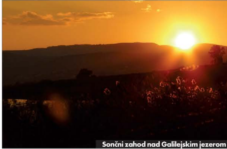
Sončni zahod nad Galilejskim jezerom

da ta, da znotraj kibuca ne obstaja privatna lastnina. Vse dobrine so šle v skupni fond, s katerim je upravljal izvoljeni upravni svet. Začetna ideja kibucev je bila samozadostnost in s tem izolacija od zunanjega sveta: zato so se ukvarjali večinoma s poljedelstvom. Kmalu pa so člani kibucev prišli do spoznanja, da ne morejo biti samozadostni in so se začeli odpirati zunanjemu svetu. Z obrtništvom in kasneje industrializacijo so postali pomembni dejavniki izraelskega gospodarstva. Kibuci so dejansko navznoter funkcionirali socialistično, hkrati pa so se kot "samoupravljalsko" podjetje predstavljali na izraelskem prostem trgu. Najbolj nenavadna in pri nas "nerazumljiva" značilnost kibucev pa je bila nedvomno skupnost otrok. Otroke niso vzgajale posamezne družine, malčki so že od vsega začetka odrasli v skupnosti vseh otrok v kibucu, ki so jim načelovali za to postavljeni vzgojitelji in vzgojiteljice. S takim sistemom so v kibucu hoteli omogočiti mamiciam, da bi se ukvarjale z vsakodnevnimi skupnimi dejavnostmi. Večino prostega časa so člani kibuca preživljali v