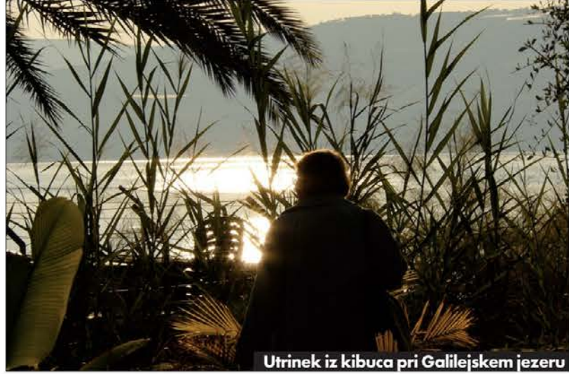
Utrinek iz kibuca pri Galilejskem jezeru