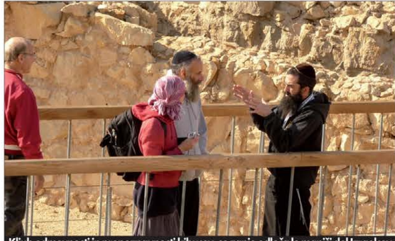
Kljub odmevnosti in prepoznavnosti kibucev, se zanje odloča le manjši del Izraelcev

socializem, komaj sliši za tipično izraelsko pogruntavščino, ki je že več kot petdeset let pravi zaščitni znak za Izrael. Govorimo o kibucih, naseljih, ki so zrasli na državni zemlji in kjer naj bi še vedno veljal zakon skupne lastnine.