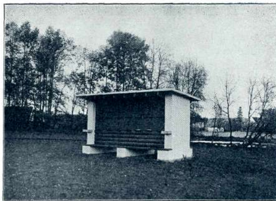
J. Plečnik, Čebelnjak

Semenič ( vstane, gleda za njim ): Če nejevoljen nisi zaradi bezjaštva, ki ga tajiš med nami Kranjci. Pa ostani! Ne bom spal.