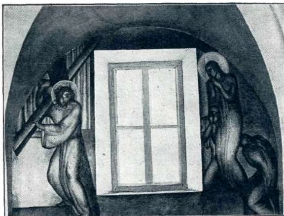
Tone Kralj, Srečanje trpečega Jezusa z Marijo

Kammerstein (za vrati): Tepec ušivi! Kamen za vrat! Nož v vamp! (Boben na trgu. Šum ljudi. Klici. Blaž Taškar kliče svoje: Straža, nared! Mir, pravim, perikula in mora! Vorwärts! Kein Par-