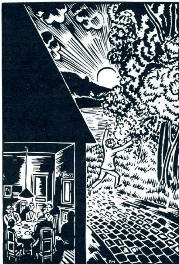
Frans Masereel (Belgijec), Ilustracija (lesorez) k Romaina Rollanda Jeanu Christophe-u

1. stavec : Stara vera, star denar. Nama dvema ne bo bolje ne pod novim županom, ki svoje ve, ne pod novim sodnikom, ki po svoje sodi. Mar sta mi, saj komaj vem, kdo sta.