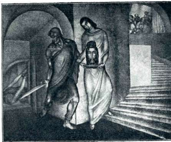
Tone Kralj, Herodijas

Staudach ( bolestno, pokaže z roko nazaj ): Tu Staudach in pravica!