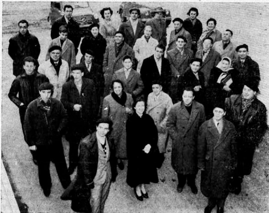
Družina Slovenskega gledališča v Trstu na lanskem festivalu jugoslovanskih dramskih gledališč v Novem Sadu. Letos je bila spet povabljenja tja s Tavčarjevo komedijo »Nicky, zlati deček«. Festival se je začel 14. t. m.

Precej slabo pa je bil sprejet v Cannesu Fellinijev film »La dolce vita« (Sladko življenje), ki je vzbudil doma v Italiji toliko zanimanja in polemik. Verjetno je vmes tudi nekoliko zavisti. Dobro so se odrezali letos Rusi s filmoma »Balada o vojaku« in »Gospa s psičkom« (po neki noveli Čehova). Zato so svoj tretji film kar umaknili, da bi morda ne pokvarili tega dobrega vtisa.