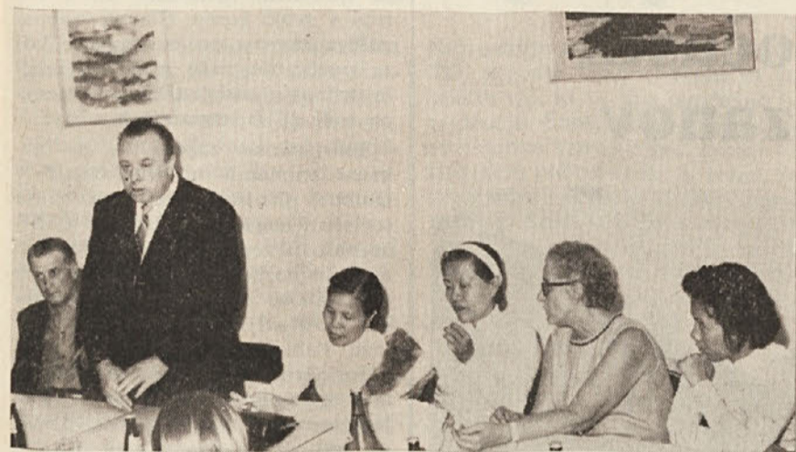
Obisk vietnamskih žena v Dolini

Med obiskom vietnamskih žena v Trstu in okolici so protifašisti še enkrat izpričali svojo vzajemnost z vietnamskim ljudstvom, ki se bori za svojo svobodo, obenem so ponovno izpričali obsodbo proti ameriškim napadalcem in njihovim napadalcem. Tržaška mladina je še pripravljena pomagati vietnamskim borcem, ker pa jim zaenkrat drugače pomagati ne more, bo ponovno darovala krvno plazmo, ki naj služi vietnamskim borcem in drugim prebivalcem, ki trpe zaradi barbarskega napada ameriških imperialistov.