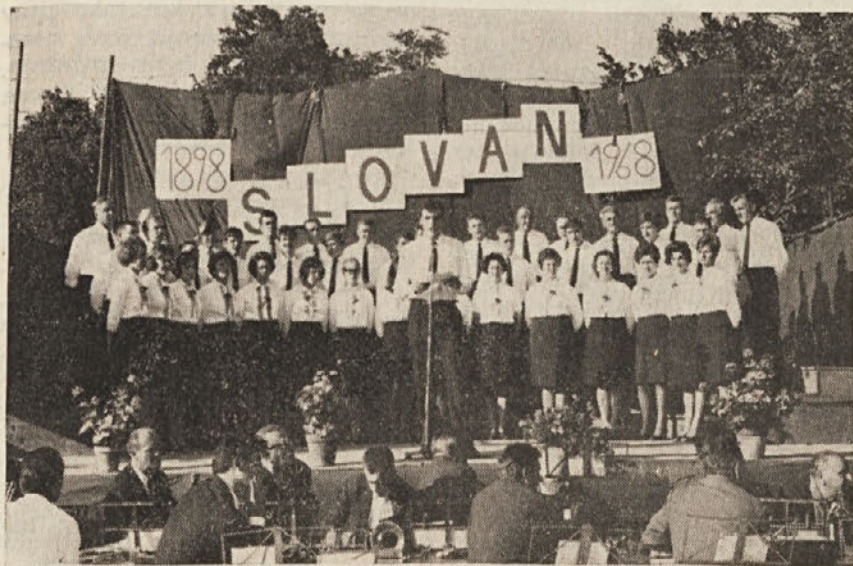
Pevski zbor Slovan na nedeljski proslavi v Padričah

Tržaška občinska uprava je razpisala natečaj za mesto uradnega prevajalca v slovenski jezik. Natečaja se lahko udeležijo osebe v starosti od 18 do 30 let, ki so dokončale višjo srednjo šolo. Prošnje, opremljene s potrebnimi dokumenti je treba dostaviti do 7. septembra 1968. Za podrobnejša pojasnila naj se prosilci obrnejo na personalni urad v palači tržaškega županstva (2. nadstropje, soba št. 92).