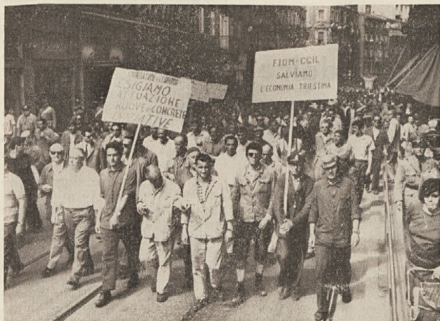
Stavka v Trstu. Delni pogled na spreved po glavnih mestnih ulicah. Delavci zahtevajo zagotovitev zaposlitvene ravnih.

obratov s stavkami še enkrat odločno zahtevali, naj na višji politični ravni resno proučijo položaj, v katerem se nahaja tržaško gospodarstvo, ter sprejmejo ukrepe, ki so nujno potrebni. Hkrati so delavci zahtevali — tako poudarjajo sindikati — naj se v celoti obdrži proizvodna dejavnost ladjedelnice Sv. Marka in Tovarne strojev, dokler ne bo zgrajena tovarna velikih motorjev.