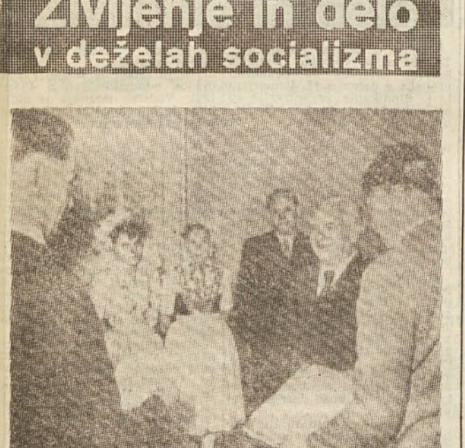
Predstavniki «Domowina» pozdravljajo predsednika Nemške demokratične republike Wilhelma Piecka.

Ko so sovjetski ljudje odhajali iz Zdravstvenih drav Amerike jih je navdajala trdna prepričanje, da v Ameriki zorj stanovitna težnja delovnih ljudi po ohranitvi