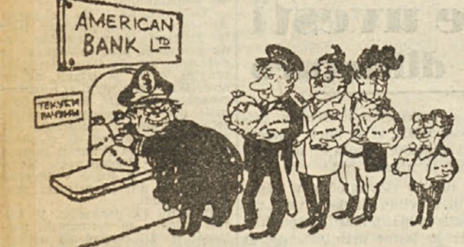
AMERICAN BANK LTD. (Po listu «Pod zastavom internacionalizma»)