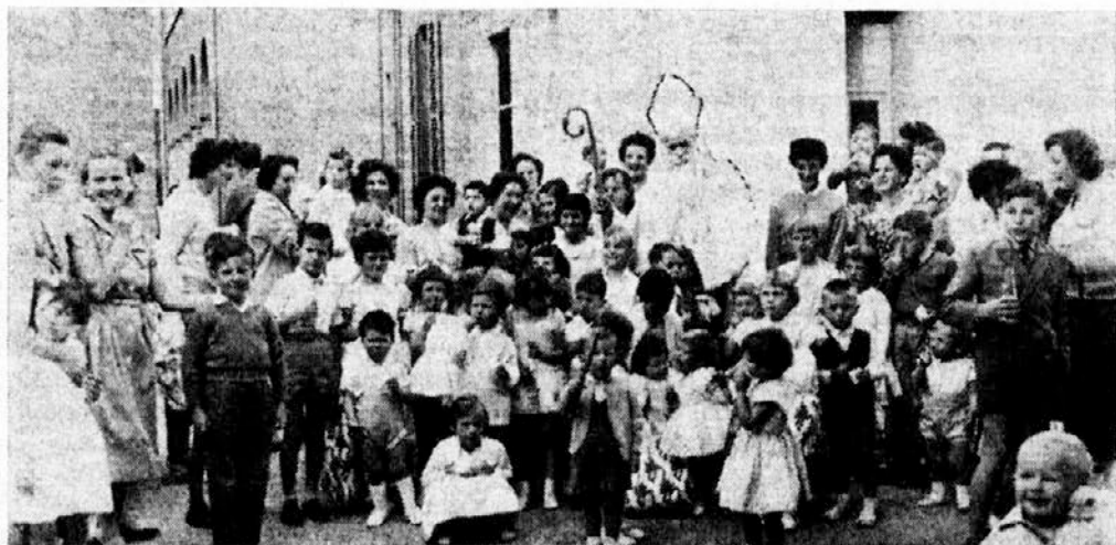
Ob Miklavževem obisku v Adelaidi 1961