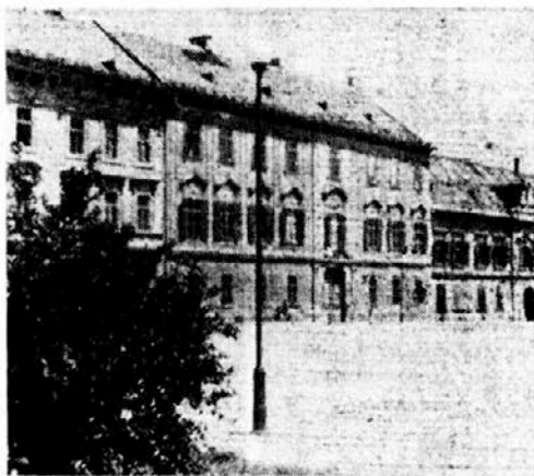
V tej hiši je Slomšek umrl.