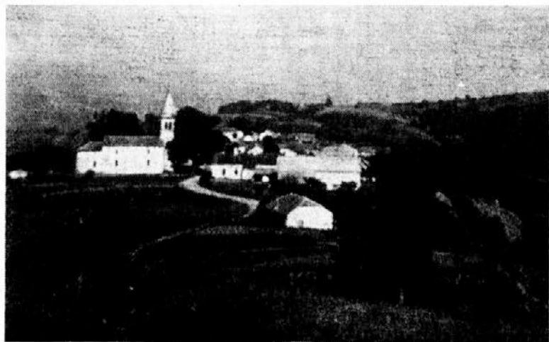
Ostrožno brdo v Brkinih, Slov. Primorje