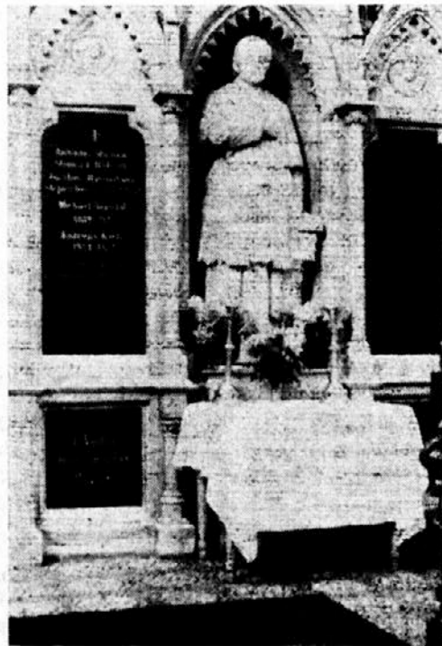
Slomškov spomenik v mariborski stolnici