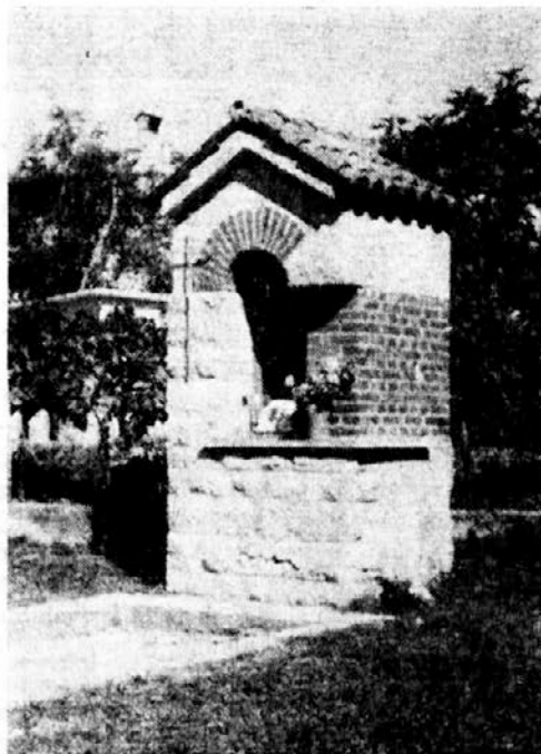
"Pilje" — kapelica — na Krasu

V tegobah in stiskah na samohodih . . . Ti ostajaš sam z menoj, večni BOG!