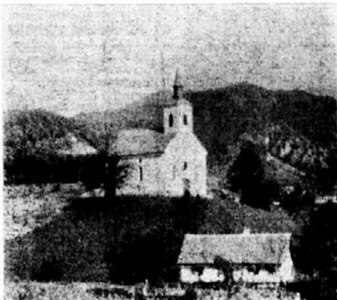
Cerkvica sv. Rozalije v župniji Kostrivnica

Po končanih duhovnih vajah je obiskal slovečo božjo pot na Ptujski gori. Tam je pustil znano pesem "Marija pribežališče grešnikov" in je, kot trde, pripisal pomenljivo kitico: "Pod svoj sveti plašč zagrinjaj mene pred sovražnikom; v sveti raj me enkrat spremljaj k vsem nebeškim angelom!"