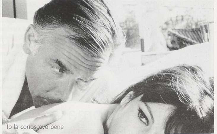
Io la conosco bene