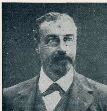
Grof I. I. Tolstoj, ruski učni minister.

Bossijeva „Visoka pesem“. „Glasb. Matica“ je prošli mesec priredila sijajen koncert. Peli so Bossijevo „Visoko pesem“, ki je zložena na besede sveto-