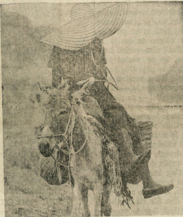
VARSTVO PRED VROČIM SONCEM — Ženska, ki jaše na osliču na trg v Port-au-Prince na Haitiju, se varuje s slannikom pred žgočim soncem.

Prijatelj's Pharmacy IZDAJAMO TUDI ZDRAVILA ZA RACUN POMOČI DRZAVE OHIO ZA OSTARELE AID FOR AGED PRESCRIPTIONS St. Clair Ave. & 68th St. EN 1-4212