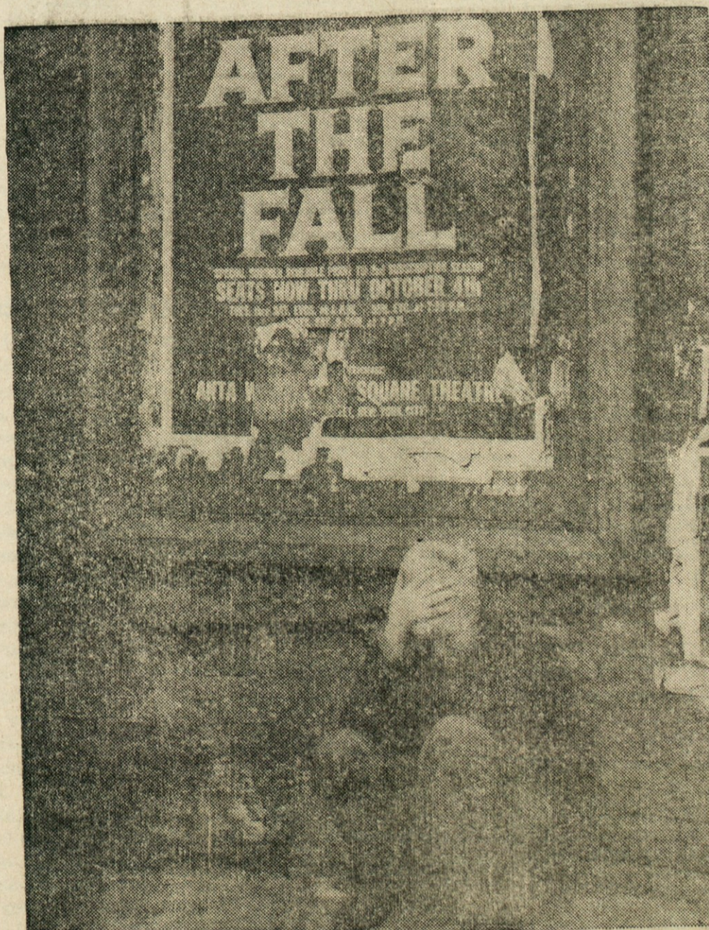
PO PADCU — Mož se je vsedel pod staro oglasno desko z obledelim starim lepakom, ki vabi na predstavo "Po padcu". Zdi se, kot simbol. Posnetek je bil napravljen v področju Bowery mesta New Yorka.