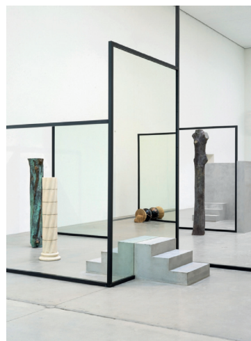
Alicja Kwade, Sub-Stance, 2019

več razmišljanja o prostoru, več sodobnih tematik in več kompleksnih vprašanj. V odnosu do samega projektiranja pa menim, da bistvo študija ni v tem, da te opremi in pripravi neposredno na delovanje v praksi – v smislu, da bi moral v procesu študija usvojiti obrtniška znanja, ki jih potrebuješ za projektivo. Dober študij mora po mojem mnenju študente predvsem naučiti metod reševanja problemov in discipline kritičnega mišljenja. Tako se bodo lahko v praksi nalog lotevali suvereno in jih izpeljali kakovostno. Pomembno je, da se v procesu študija med drugim poudari pomen branja prostora, analitičnega mišljenja in vrednotenja odločitev, ki pripeljejo do rešitve. Slednje moramo znati ustrezno predstaviti in jo seveda tudi uresničiti v praksi. Projektno usmerjeno delo na naši fakulteti je zato ključnega pomena. Tako razvijamo sposobnost prepoznavanja in reševanja problemov. Vedno zaznaš problem in vidiš potencial ter se usmeriš k iskanju rešitve. Ko usvojiš to sposobnost, lahko zelo hitro pridobiš tudi druga znanja, ki so potrebna za projektiranje in delo v praksi.