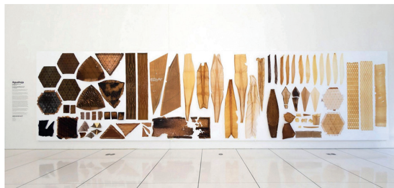
Neri Oxman, Material Ecology, Aguahoja, MoMA, 2020

»Trenutno me zelo zanima, kako oživiti vlogo arhitekture v družbi, predvsem s pomočjo izobraževanja.«