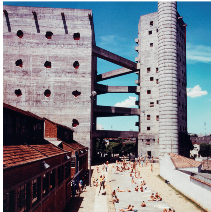
Lina Bo Bardi, Sesc Pompeia, Sao Paulo, Brazilija, 1982

Morda le kot izravnalni ukrep ( smeh ), dolgoročno pa ne. Kot desetletno spodbudo, morda kot nagrado, ki opozori na uspešne ženske v arhitekturi. A le za omejeno obdobje.