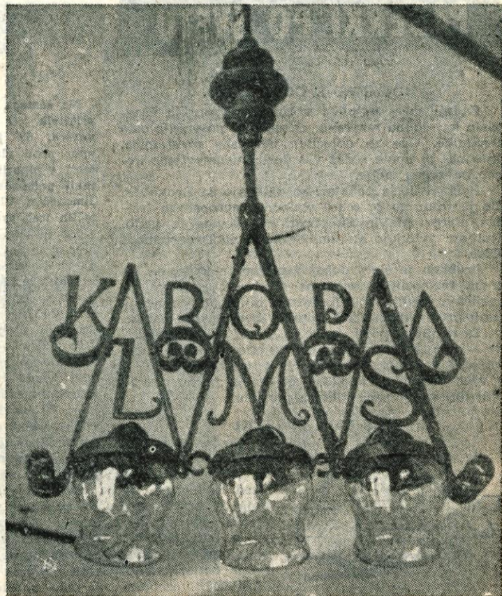
Danes, v ponedeljek, se je začel v Beogradu VI. kongres Ljudske mladine Jugoslavije. Kongresa se bo udeležilo tudi 10 delegatov gorenjske mladine. V Beograd so te dni prišle nekatere mladinske delegacije tujih držav.

Osnovna organizacija LMS tovarne »UKO« in »Plamen« v Kropi sta pripravila za VI. kongres jugoslovanske mladine lepo darilo, ki ga vidite na sliki.