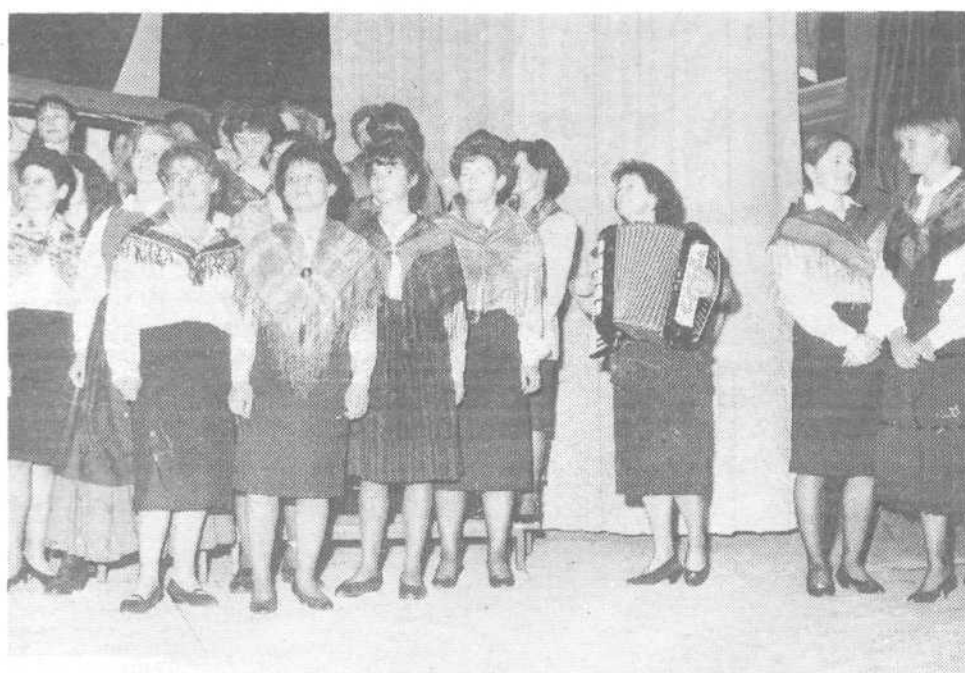
Zborovodkinja mešanega pevskega zbora je razpotegnila meh ob interpretaciji Prešernovih pesmi.