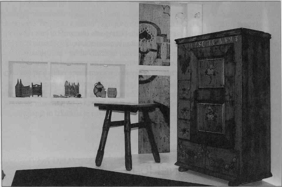
Z razstave V sožitju z lesom, predstavitve Belinke in Slovenskega etnografskega muzeja na sejmu Alpe Adria. (1995)