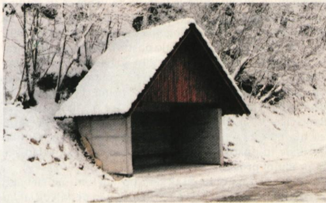
Odslej naprej bo sneg na strehi postaje, ne na glavi čakajočih