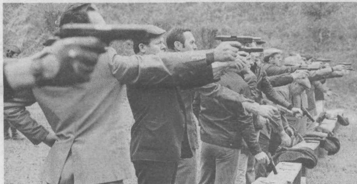
LJUBLJANSKO ARMADNO OBMOČJE