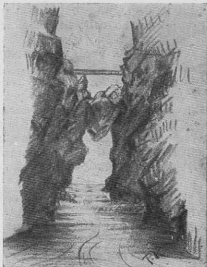
Mali Predoselj po 26. X. 1952: Slap je izginil, pokazala se je zagozdena skala — drugi naravni most —, 200 sežnjev zagozdenega leša in okoli 4000 m 3 proda je voda odnesla. (Risal P. Kunaver)

strani z ozke police v apnenčevi steni. Pozneje so naredili tam čez mostiček in varne stezice nad slapom in po kotanji nad jezercem. Po drugi vojni so vse te naprave popolnoma propadle, kar bo vzrok, da posebno mladina ne bo vedela in razumela velikih izprememb, ki so se zgodile v tem delu Predoslja dne 26. oktobra 1952 in ki so posegle tudi v znanstveno razumevanje nastanka spodnjih delov Predoslja.