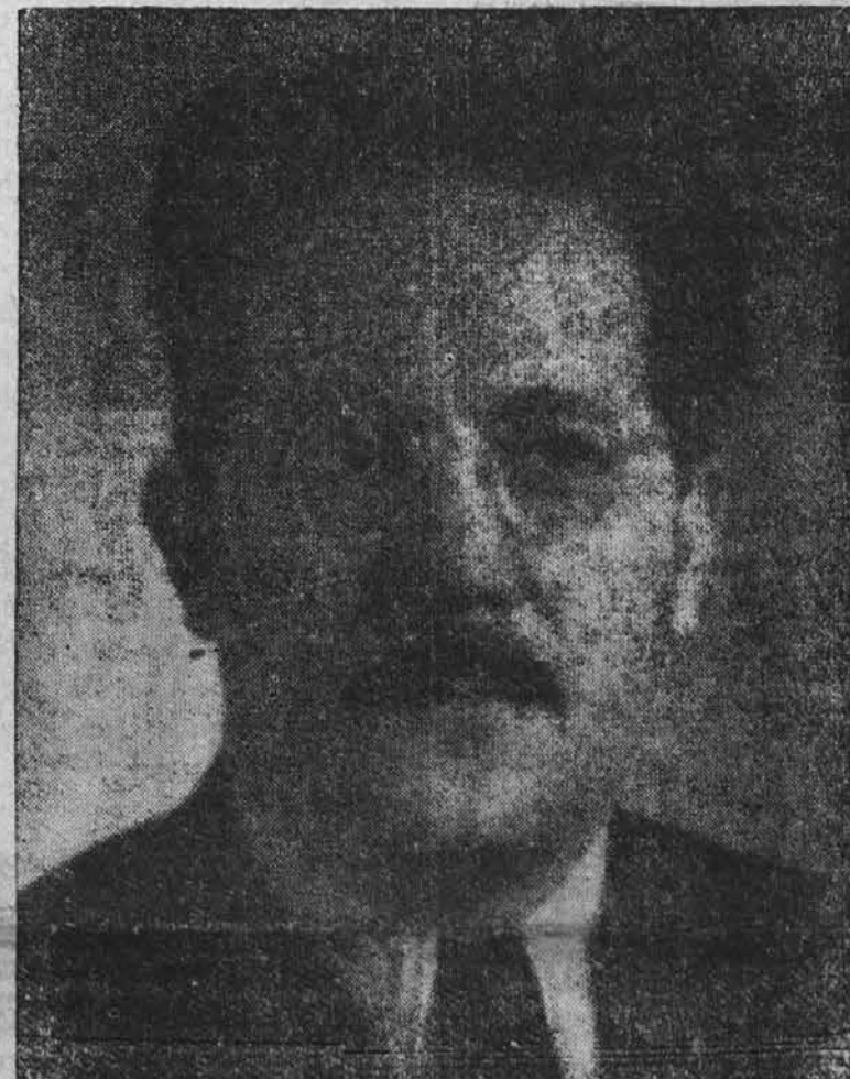
Edvard Kardelj, novi zunanji minister

BEOGRAD, 31. avgusta—Premijer maršal Tito je izvršil spremembe v jugoslovanski vladi in postavil na važne ministrske položaje svoje pristaše, ki ga podpirajo v sporu s Kominformo.