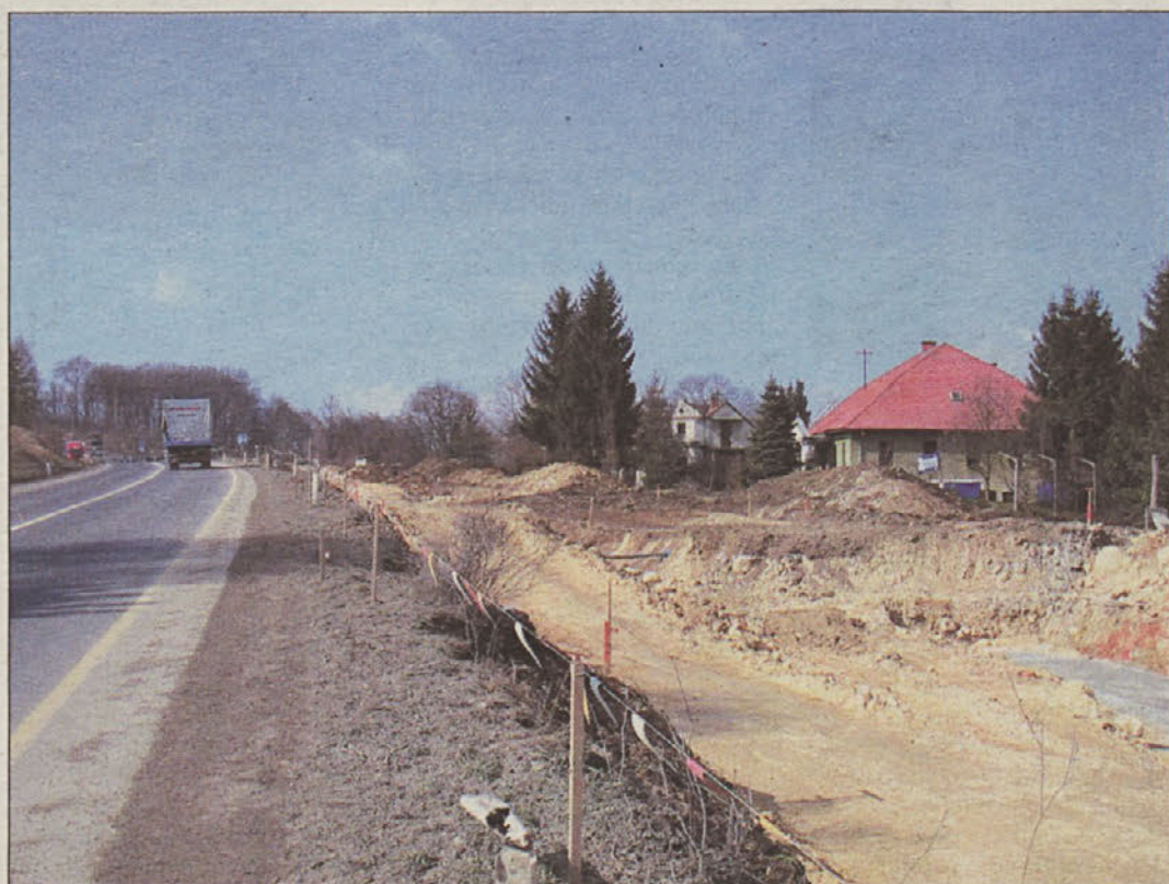
...na strani 4 Področje Čateža, kjer so se dela pričela, bo povsem spremenjeno.

Na brežiškem področju pa so na območju Čateža težki gradbeni stroji že zarezali v hrib, ki bo povsem spremenil zdajšnjo podobo. Na območju pod Petrolovim motelom bo avtocesta povzela sedem stanovanjskih hiš in gospodarskih objektov, prve hiše so že zravnane z zemljo. Lokalna skupnost je uspela z zahtevo po ukopu avtoceste na tem področju, od bencinskega servisa mimo naselja s cerkvijo. Prebivalci krajevnih skupnosti Jesenice na Dolenjskem in Čateža ob Savi pa ob pomoči Občine Brežice že bijejo boj z državo in izvajalci del za ohranitev cest, ki jih pri delu uporabljajo, ter njihovo sprotno čiščenje v času gradbenih del za avtocesto.