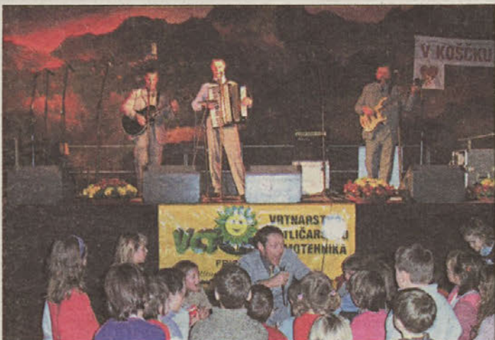
Čuki so zabavali staro in mlado