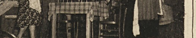
Prizor iz prvega dejanja

vo Zalos ter z drugimi zahtevnimi deli. Nedvomno je, da spada komedija «Pesem s ceste» med zelo zahtevne igre. Pri nas pride to tem bolj v poštev, ker je isto komedijo pred nekaj leti uprizorilo tudi SNG.