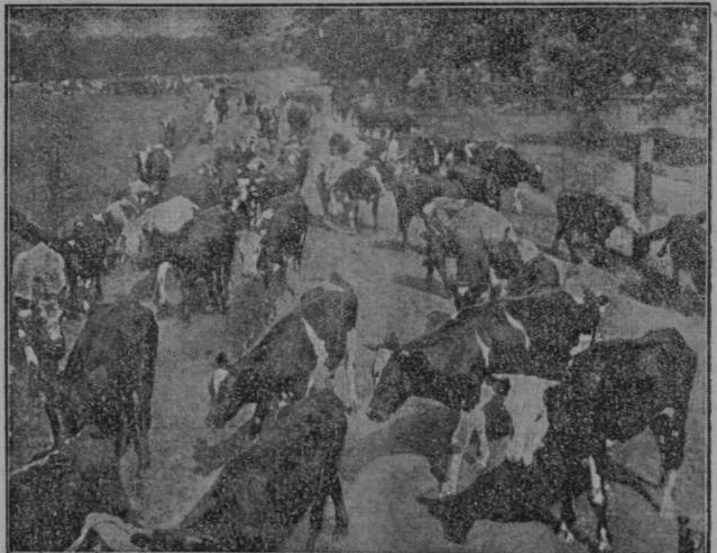
Radi strahotne suše gonijo po Združenih ameriških državah na tisoče glav goveje živine v klavnice.