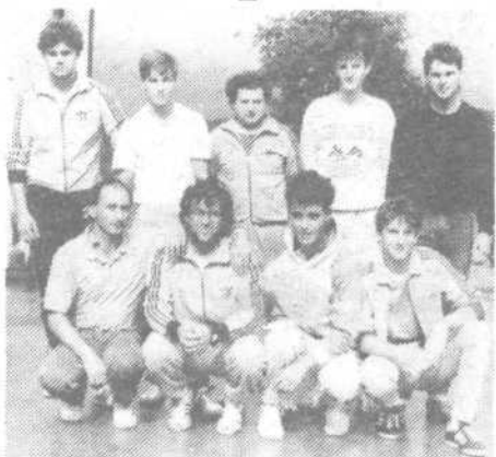
Na turnirju v malem nogometu se je najbolje odrezalo moštvo »Jama Berda« iz Podpeč-Preseje