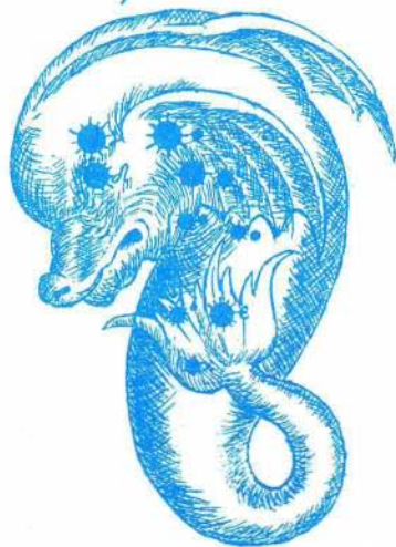
Slika 1. Takole je ozvezdje Delfina narisano v starem zvezdnem atlasu Uranometrija iz leta 1645.