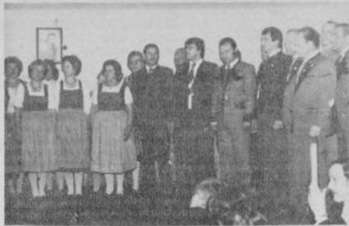
Mešani pevski zbor iz Leobna med nastopom v kulturnem domu pri Kungoti.

Največ aplavza je požel mešani pevski zbor iz Leobna, ki je ob koncu svojega programa zapel še tri slovenske narodne in eno dalmatinsko. Med pevkami iz Leobna je bila tudi 71-letna žena, ki je še