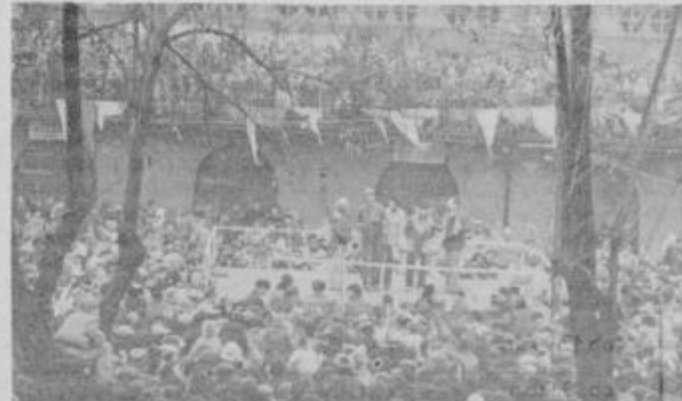
Na Titovem trgu se je obiskovalcev kar trlo