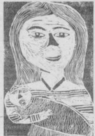
Mama se veseli — linorez Martina Horvat 6. c OŠ Tone Žnidarič

Kmalu je dopolnila dvajset let in se poročila. Zakonska sreča ji ni bila dana, zato sva ostali sami. Dobila je stanovanje in zaživel sva polni upanja v boljšo bodočnost. Kot trgovska pomočnica zaslužila zelo slabo. Iz dneva v dan opažam, da je kljub vsem težavam moja