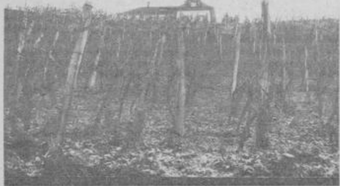
V Halozah je treba pospešiti razvoj živinoreje in vinogradništva. Večina vinogradov pa je starih in potrebnih obnove, kar pa zahteva precej denarja, ki ga kmetje nimajo.

Koordinacijski odbor deluje že leto dni. V tem času so sklicali nekaj sestankov, nanje so povabili tudi predstavnike občinske s skupščine in družbenopolitičnih organizacij, pa tudi predstavnike republiškega iz-