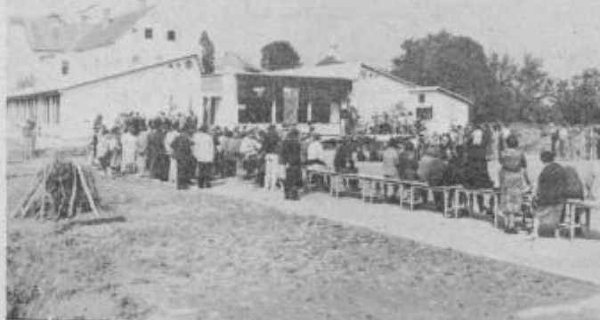
Osnovna šola Veljko Vlahovič na Črešnjecu je središče kulturnega življenja KS Črešnjavec.