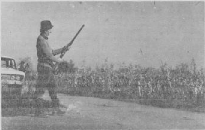
Med pogonom na enem od lovišč na območju ptujske občine

»Lovske organizacije se bodo v bodoče prek ZLS Ptuj z vso