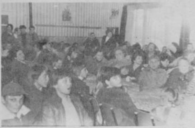
Dvorana na proslavi v Apačah je bila nabito polna.