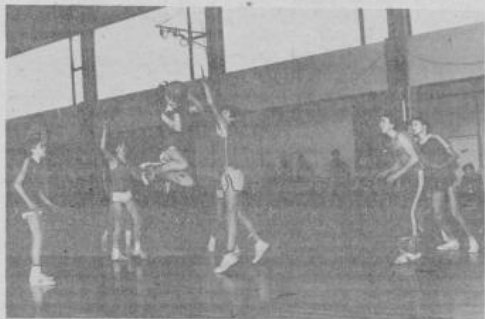
Mladi igrajo vedno bolj kvalitetno

Nastopi v medobčinski ligi sodijo tudi v okvir priprav ekip na letošnji festival košarke, v katerem imajo ptujske ekipe precejšnje možnosti, saj