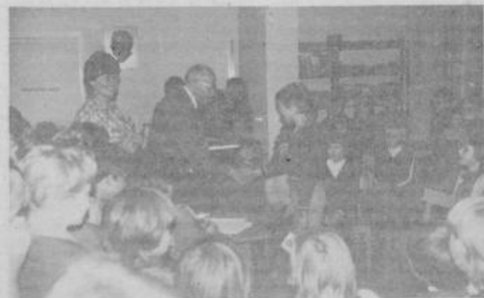
Srečanja s pisateljem ob zaključku tekmovalnj za Ingoličevo bralno značko so še posebno prisrčna in nepozabna.

slov častnega občana, kjer je zapisano: „S svojim pisateljevanjem,