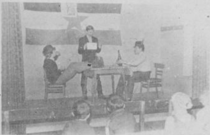
Skeč, ki so ga v kulturnem programu pripravili mladi v Medvedcah