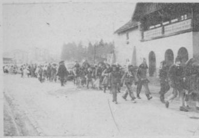
Maske na pohodu v občinskem središču Slovenska Bistrica.

S predpustnimi praznovanji so v skoraj vseh krajih bistriške občine pričeli že v soboto, 28. februarja, ko so predvsem v večernih urah bili vsi gostinski lokali polni tistih, ki jim je pustna „beseda“ tekla ne da bi se bilo potrebno maskirati, drugi so svoje norčije zganjali pod masko nevšakdanjosti.