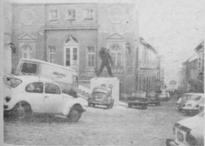
Današnje stanje