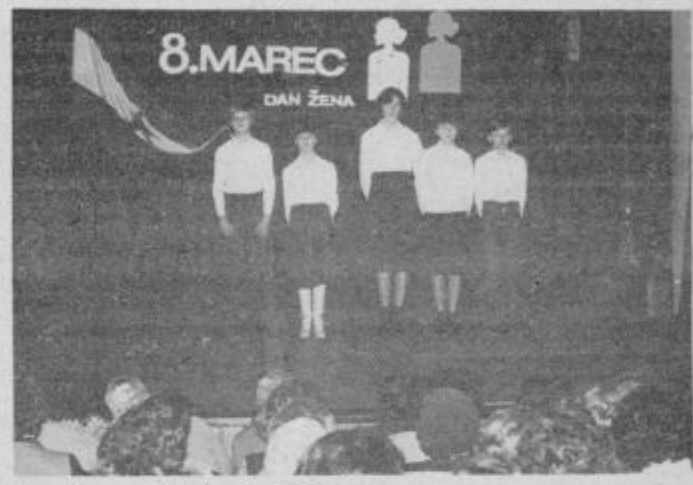
S proslave v gledališču

„Današnji trenutek je izredno zahteven. Splošna krizna situacija v svetu, gospodarske težave, ki smo jim priča, srednjeročno obdobje, ki ga načrtujemo in letos pričujemo, vse to postavlja pred nas velike naloge. Prestrukturiranje gospodarstva, napor za stabilnejši razvoj gospodarstva in nadaljnji razvoj na področju družbenih in delegatskih odnosov ter krepitev sistema socialističnega samoupravljanja, so področja dela kjer so in morajo biti ženske neposredno vključene. Zato je potrebno zagotoviti pogoje, da bo ženska v združenem delu imela vse možnosti za popolno uve-