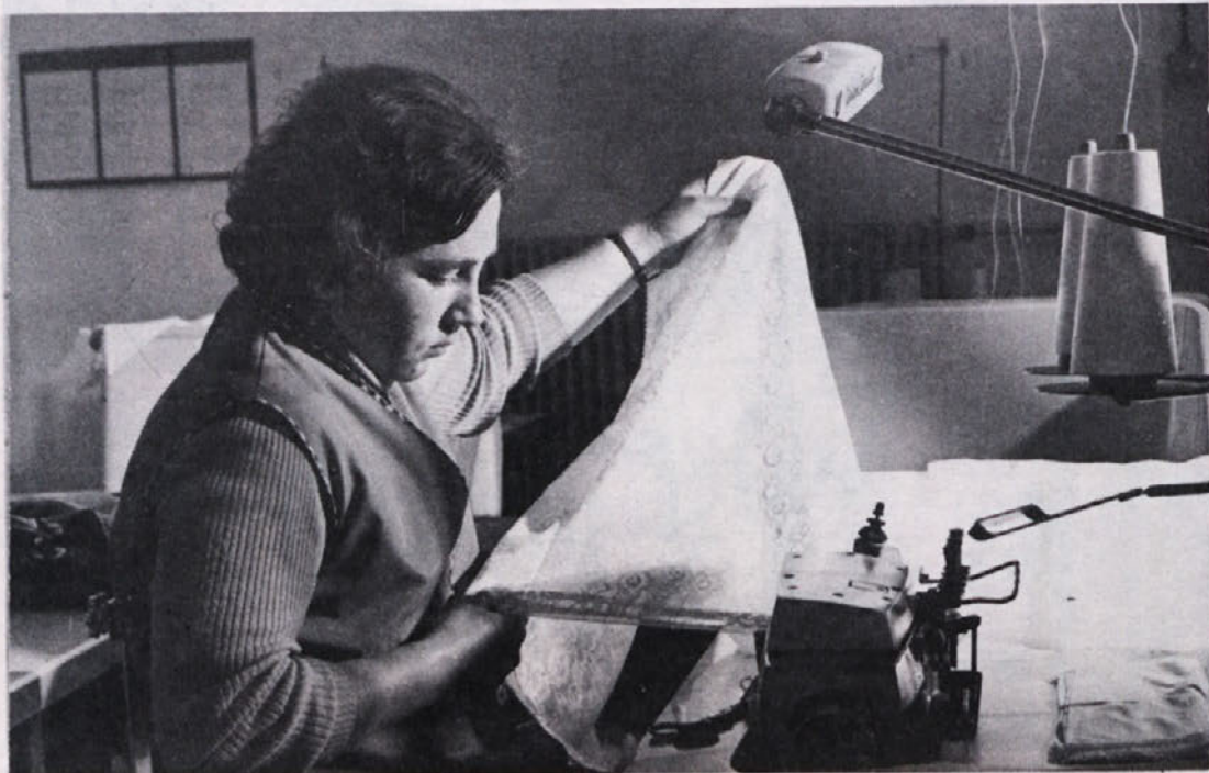
Motiv iz proizvodnje v TOZD Dobova, kjer so zaposlene pretežno ženske, med njimi tudi matere. Otroško varstvo je zanje eden najbolj perečih problemov, ki terja rešitev