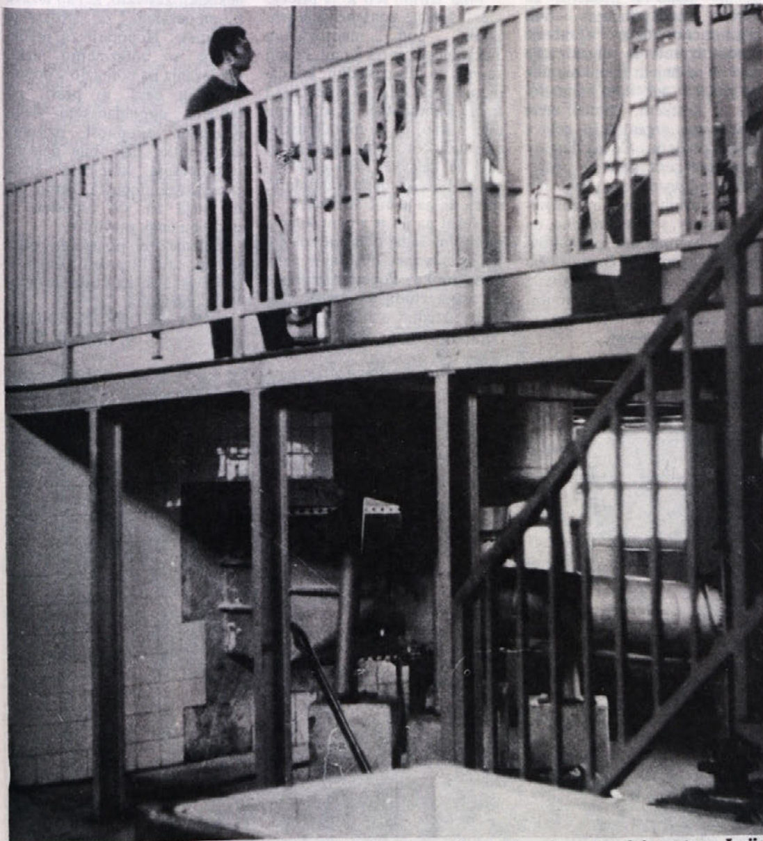
V barvarni večkrat stojijo stroji in ljudje ob njih, ker je zaradi nečiste vode proizvodnja motena. Jezijo pa se tudi, kadar je treba postopek barvanja ponavljati.