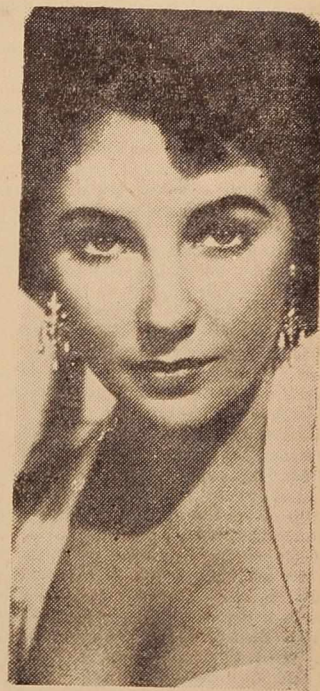
Elisabeth Taylor — ameriška filmska igralka

Medtem ko nas v Evropi pošteno zebe, pa je v Argentini zadnje dni tako vroče, da ljudje umirajo zaradi vročine. Pred nekaj dnevi so imeli v Buenos Airesu 42 stopinj Celzija vročine, kar se v zadnjih 100 letih še ni zgodilo. 20 ljudi je umrlo zaradi sončarice.