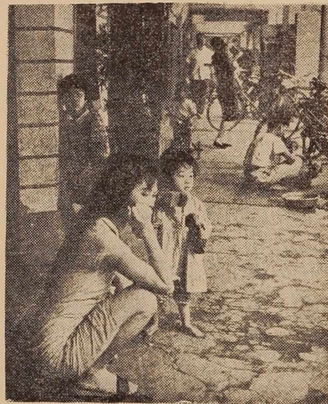
Prizor s tokijske ulice

Vendar je policija zbrala toliko dokazov, da so Hirisavo obsodili na smrt in bi sodba morala biti izvršena letos. Vendar mnogi na Japon-