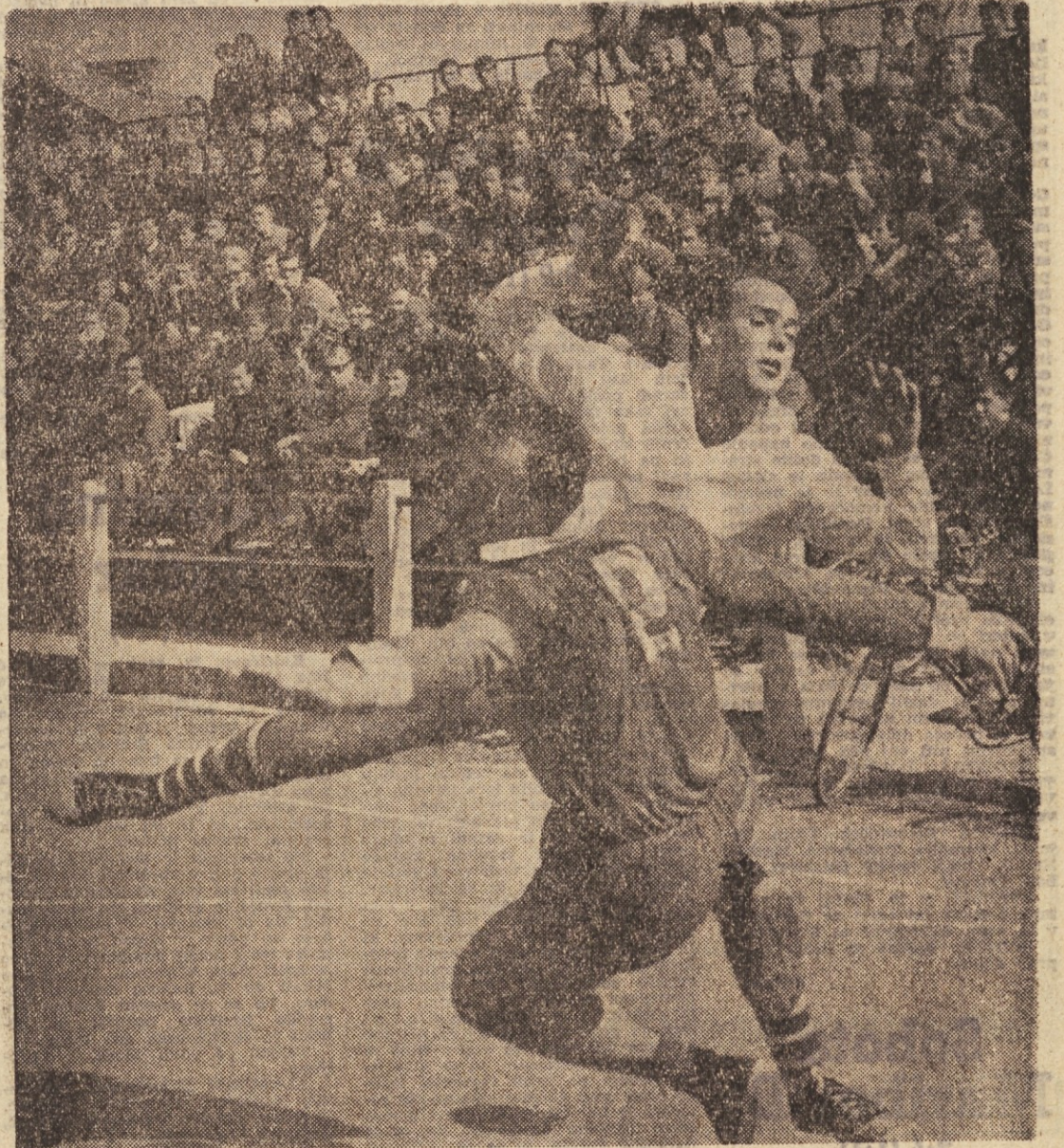
V Ljubljani je bilo danes derby srečanje republiške moške rokometne lige. Na igrišču Slovana so bili domačini uspešnejši. Na posnetku Vojska (OI) in Sparmblek (SI).