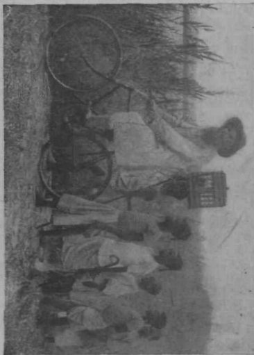
Misijsionar s svojimi zamorčki na potovanju.

ki onemogla vsled krutega ravnanja ni mogla dalje, so tu prepustili njeni usodi. Kadšaki prinese ženi v neki črepinji, ki jo je našel v taborišču, vode, pa poišče tudi sadežev za hrano sebi in bolnici ter naslednjo noč prebije na drevesu, pod katerim je počivala uboga žena. Nato se novega dne počasi po-