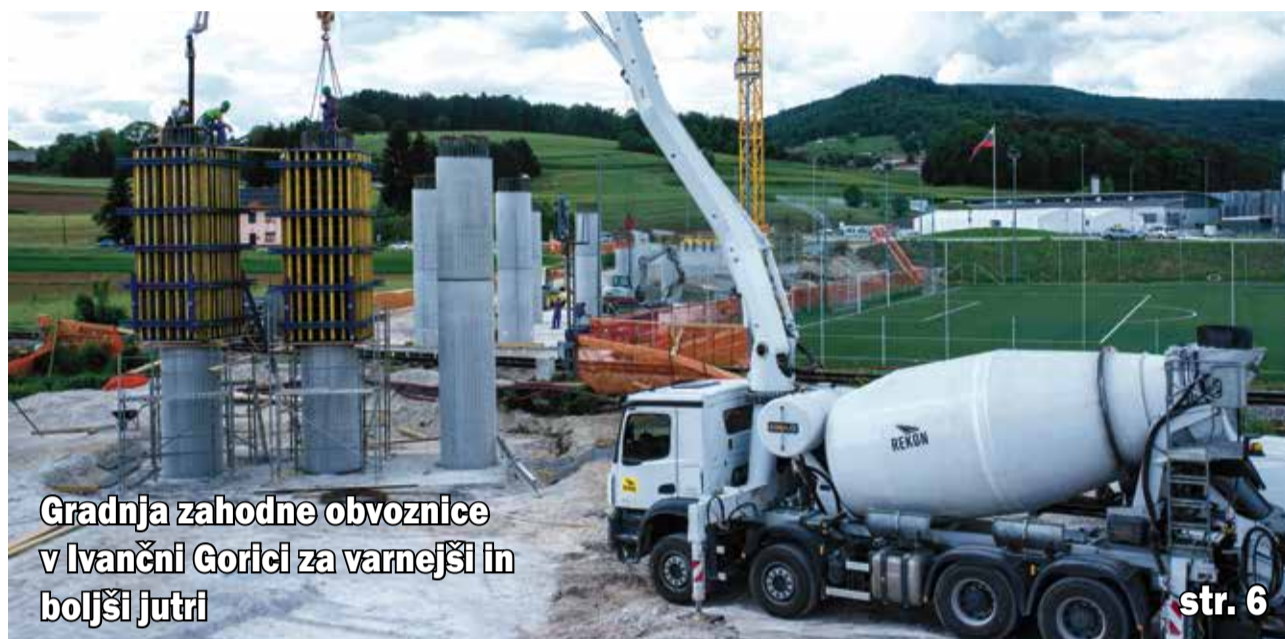
Gradnja zahodne obvoznice v Ivančni Gorici za varnejši in boljši jutri