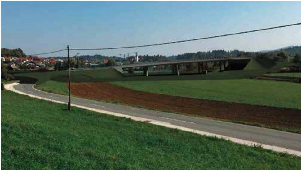
Prikaz kako bo izgledal novi nadvoz

Zahodna obvoznica, ki jo gradi domači izvajalec Eltim, bo dokončana do začetka novega šolskega leta, CGP Novo mesto pa bo nadvoz zaključilo v začetku naslednjega leta.