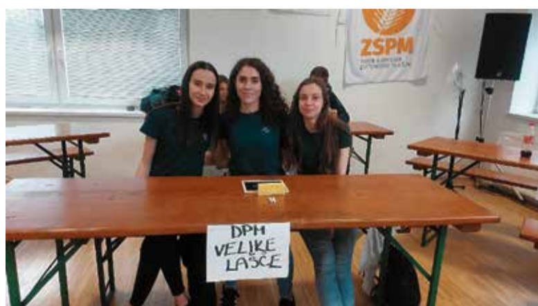
Zmagovalna ekipa DPM Velike Lašče.

DPM Kalček je v sodelovanju s KGZS Zavod Ljubljana 7. 5. 2022 v prostorih podružnične šole v Hrastovem Dolu organiziral regijski kviz »Mladi in kmetijstvo«. Letošnje teme regijskih kvizov so zajemale znanja iz področja semenarstva, poznavanje krškopoljskih prašičev ter teme iz področja travnikov v območjih Nature 2000. Za zmago se je potegovalo šest ekip: tri ekipe DPM Litija in Šmartno, dve ekipi DPM Kalček in ekipa DPM Velike Lašče. Vse ekipe so pokazale veliko znanja in se zavzeto borile za 1. mesto.