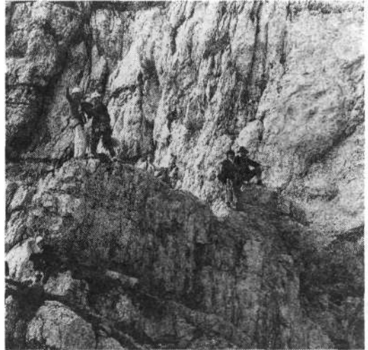
Helikopter je ekipo in opremo vsako jutro pripeljal v steno, kjer so se filmarji in njihovi alpinistični varuhi takoj lahko posvetili delu