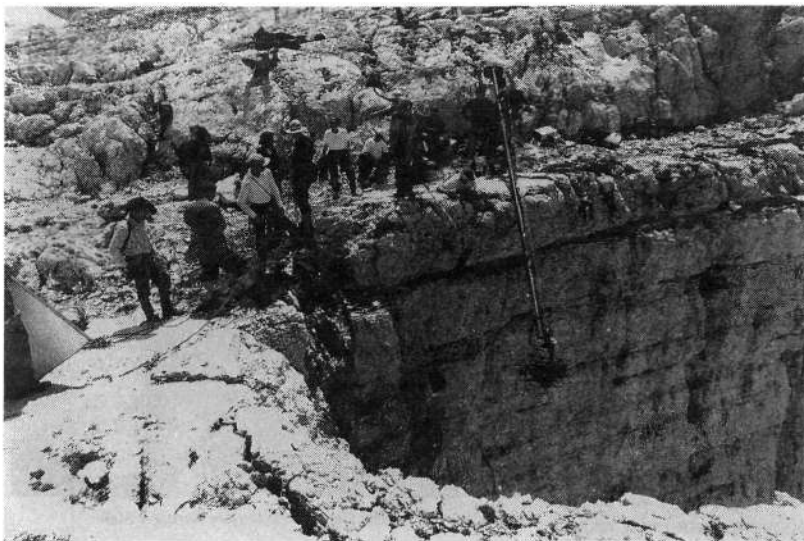
Kadar je bila stena taka, da snemalec nikakor ni prišel plezalcema blizu, je pomagala drugačna tehnika

riča sta se, da bo Čop sam poskusil izplezati, priti v Vrata in se po soplezalko vrniti z gorskimi reševalci.