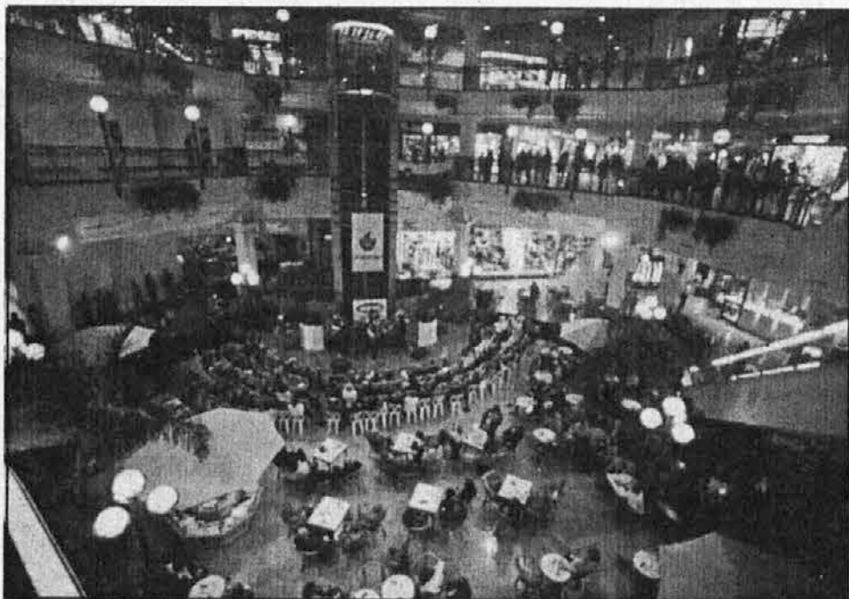
Pogled v salon med izvajanjem orkestra Rock & Polka.