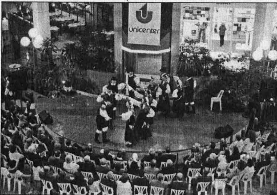
Folklorna skupina s Pristave je predstavila več skupinskih narodnih plesov.