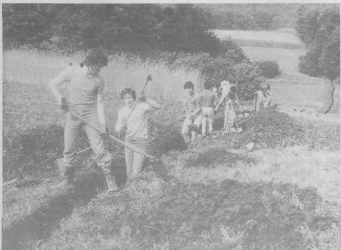
Mladi rodovi povzemajo dobre tradicije prejšnjih. Žele si tudi medsebojne povezave. Veterani delovnih akcij, oglasite se! Na sliki: Z delovne akcije Suha krajina 78